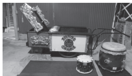
▲助成金を活用し新調した大太鼓と小太鼓、屋台小屋台

東館区（館本区・桃ノ木区・石田区）では、この助成を活用し、町最大の祭典である八雲神社祭典「天王祭」で使用する、太鼓と屋台小屋台を新調しました。これにより、一層の盛り上がりが見込まれます。