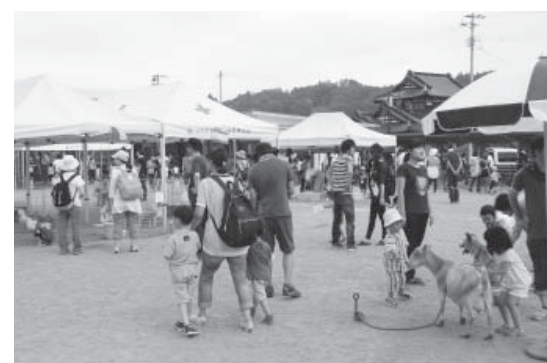
やまつりこども園庭に開かれた動物園