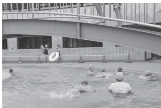
流水プールを楽しむ利用者

7月20日(木)、スインピア矢祭の屋外プールがオープンしました。補修された流水プールとウォータースライダーをはじめ、幼児用プールやすべり台など暑い夏を乗り切るために多くの親子や小中学生が訪れ、歓声をあげていました。なお、屋外プールは8月31日(木)までオープンしています。