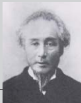
【かつ かいしゅう】 勝 海舟 (1823~1899)

明治時代に社会のあり方や人の生き方をさとした人物。大阪で生まれ、25歳のときに咸臨丸に乗船し米国へ渡りました。 日本に帰国後は、様々な書物を出版する中で、1872年(明治5年)