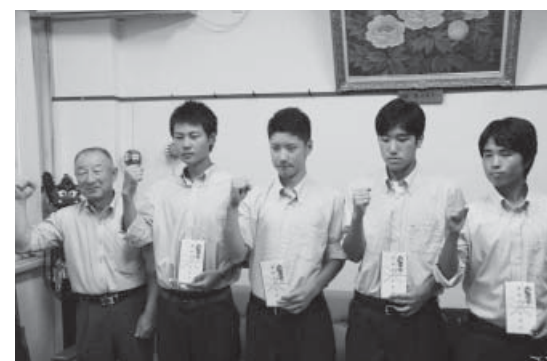
激励金を交付され決意を新たにする修明高校の4人