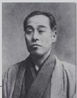
【ふくざわ ゆきち】 福澤 諭吉 (1835~1901)

に福澤諭吉の最も有名な著書である「学問のすすめ」の初編が刊行されました。 現代では、日本紙幣の中でも一番高価である1万円札に描かれている人物としても有名です。