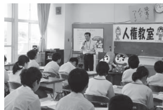
矢祭中生に講話をする人権擁護委員

身近な情報を寄せてください。自立総務課総務グループ TEL 0247-46-3131 FAX 0247-46-3155