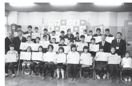
表彰された児童・生徒たち