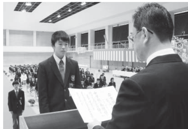
▲矢祭中学校卒業証書授与式 ▼東館小学校卒業証書授与式

町内小中学校の卒業証書授与式は、3月11日(金)に矢祭中学校、3月23日(水)に5つの小学校でそれぞれ挙行されました。今年度の卒業生は矢祭中学校49人、町内小学校49人(東館小学校20人、下関河内小学校7人、関岡小学校4人、内川小学校3人、石井小学校15人)の合わせて98人で、各学校長より卒業証書を受け取りました。このうち、5つの小学校では最後の卒業式を迎えることとなり、地域の方や先輩卒業生が参列する学校もありました。卒業生たちは、馴れ親しんだ学び舎に別れを告げ、次のステージへと羽ばたいていきました。