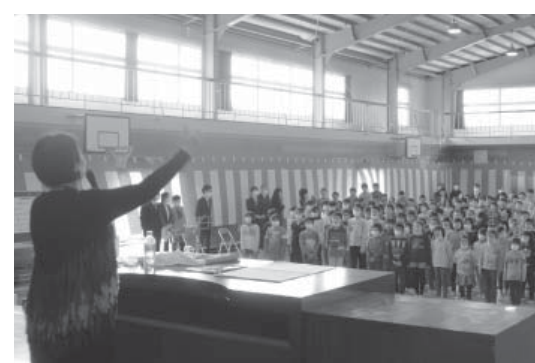
一ノ関先生の指導を受けて元気に歌う児童たち