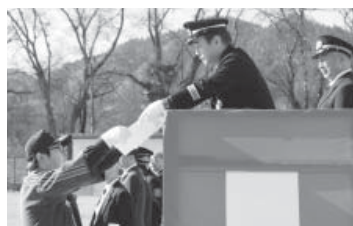
優良団員表彰を受ける団員