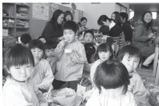
保護者の方と一緒にお昼を食べる園児たち

1月28日(木)、やまつりこども園幼児教育部保育参観が行われました。園児たちは普段通りの元気な姿を見せ、保護者の方はそんな園児たちのクラスでの活動や感動体育の様子を参観していました。お昼には普段園児たちが食べている給食を園児たちと一緒に試食していました。