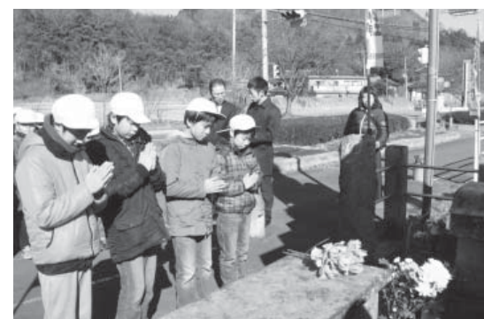
先輩の冥福を祈り合唱する関岡小の児童