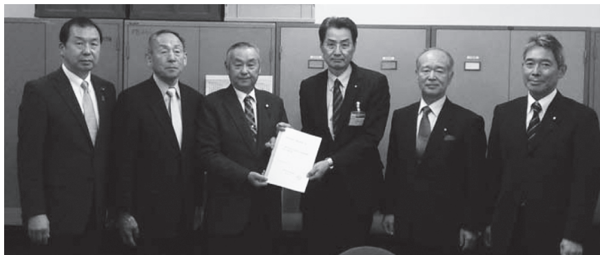
大河原土木部長に要望書を渡す東白川地方町村議会議長会