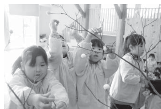
だんごを瑞の木にさす園児たち