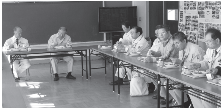
「執行部と学校給食を試食する議員」