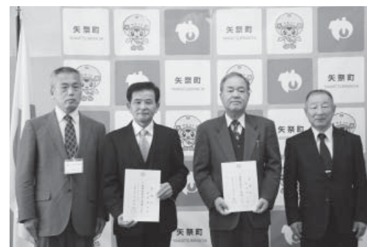
人権擁護委員の委嘱を受けたお二人(中央)

身近な情報を寄せてください。自立総務課総務グループ TEL 0247-46-3131 FAX 0247-46-3155