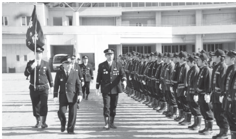
通常点検を受ける団員