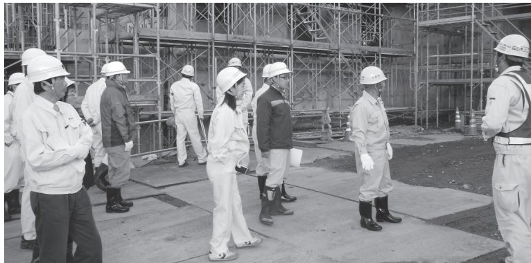
「工事現場を視察する議員」

元町有林で、事業課の担当者より説明を受けました。 また、学校給食を東館小学校で試食し、工事を行っている矢祭小学校の建築工事現場を視察しました。