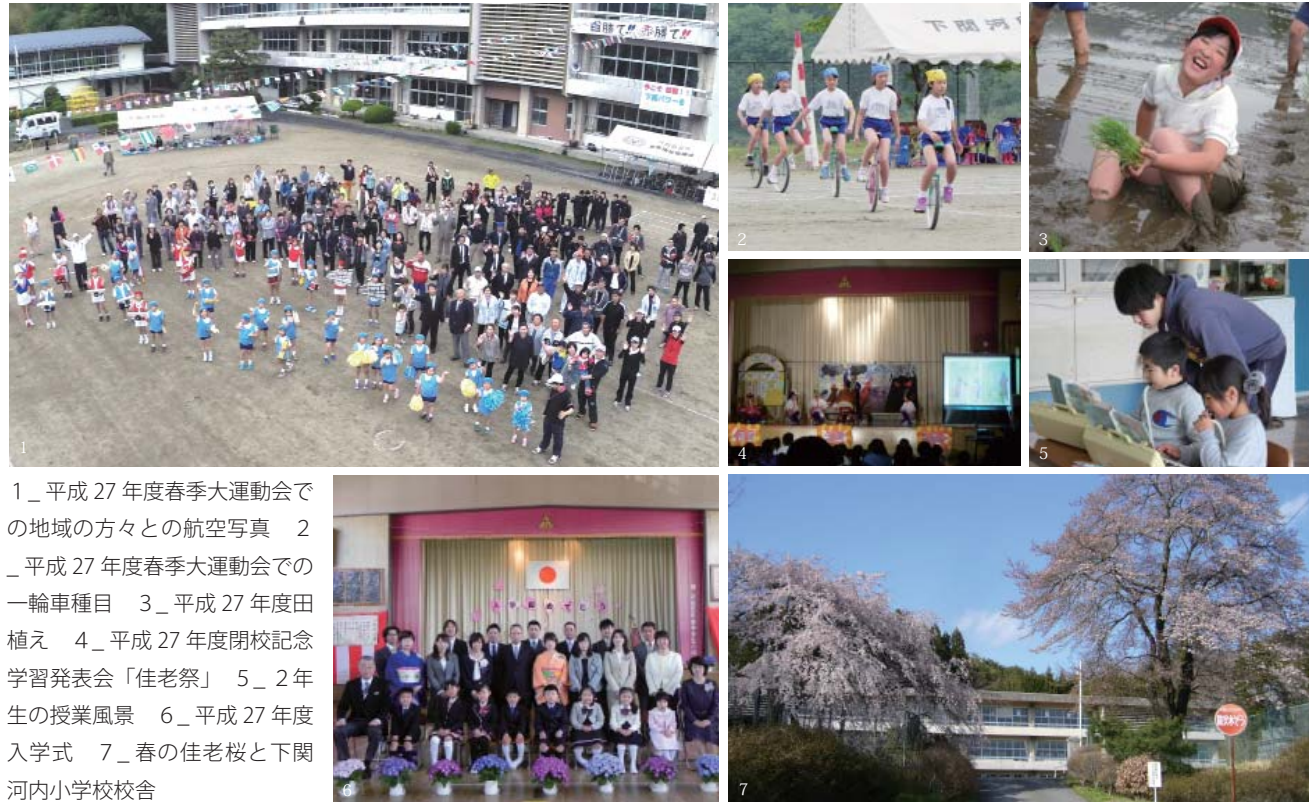
1_平成27年度春季大運動会での地域の方々の航空写真 2_平成27年度春季大運動会での一輪車種目 3_平成27年度田植え 4_平成27年度閉校記念学習発表会「佳老祭」 5_2年生の授業風景 6_平成27年度入学式 7_春の佳老桜と下関河内小学校校舎