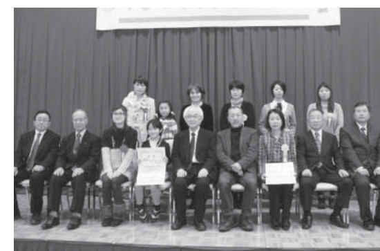
審査員、ご来賓の方々と受賞されたみなさん