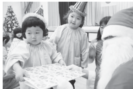
サンタさんからプレゼントをもらう園児たち

12月16日(水)、やまつりこども園お遊戯室でクリスマスお楽しみ会が開催され、園児たちは生活発表会で演じた劇などを行いました。やまっぴーやサンタクロースも登場し、サンタクロースからは園児全員へプレゼントが贈られ、会場は園児たちの喜びの声に包まれました。