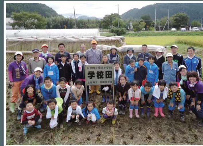
1. 関岡小学校学校田での稲刈り 2. 平成27年度大運動会(3・4年生) 3. 平成27年度入学式 4. 平成27年度閉校記念わかあゆ祭(学習発表会) 5. 太郎の四季での直売体験(1・2年生) 6. 平成27年度大運動会(地域の方) 7. 郡陸上大会(5・6年生)

私が関岡小にいた頃は、校舎が木造で隙間からの風が冷たかったことを覚えています。また、男子トイレに蛇がいたこともあり、授業で裏の山へ山菜を取りに行ったり、夏休みには、毎日学校のプールで泳いでいたりいろいろな思い出がありました。