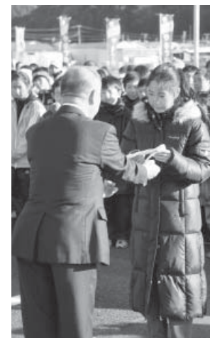
町長より襷の授与