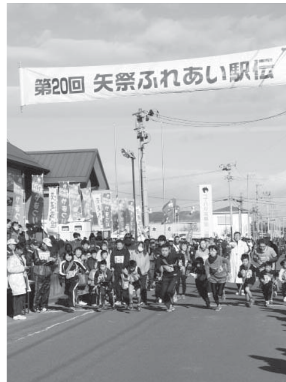
ファミリーチャレンジの部スタート

12月6日(日)に第20回記念矢祭ふれあい駅伝競走大会が開催されました。午前8時30分からスインピア矢祭駐車場にて開会式を行い、選手宣誓や襷の授与の後午前9時30分からスインピア矢祭前町道を順次スタートしました。 今大会は、ファミリーチャレンジの部(小学3年生までの幼児・児童及び保護者)、I部(小学生男女)、II部(中学生男女)、III部(高校生以上男女)の部門で分けられ、123チームが参加し行われました。競技中は、チームメイトや保護者の方などたくさんの方が沿道から熱い声援を選手たちに送っており、その声援に応えようと選手たちは力走を見せてくれていました。 大会結果等は矢祭町のホームページに掲載されていますのでご覧ください。