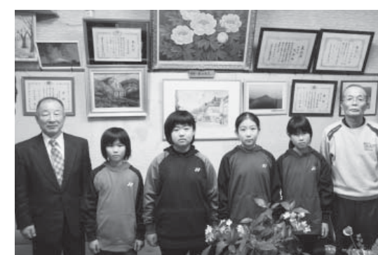
全国大会出場を決めたみなさん