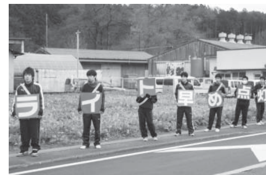
運動に協力し生徒たち