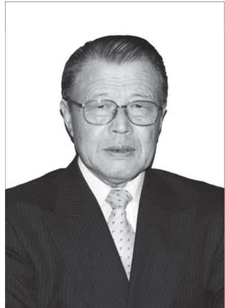
矢祭ふるさと会会長

本年も会員相互の親睦と矢祭 町との絆をより強いものにする よう役員・会員一致協力して活 動していきたいと思っております で、皆様様のより一層のご支援ご 協力をお願い申し上げます。新年の 挨拶と致します。