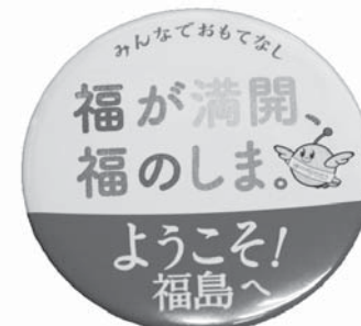
おもてなし缶バッジ