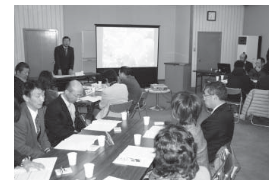
活発な協議が行われた委員会

2月24日、町地域学校保健委員会が山村開発センターで行われました。委員会には学校医や小中学校長、PTA会長、町関係など約40人が参加。むし歯や肥満、受動喫煙防止を重点に子どもたちの健康課題の解決と健康づくりの推進についての取り組み状況の報告や協議が行われました。