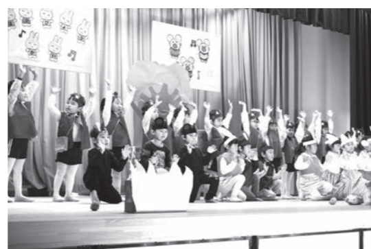
練習の成果を発表する園児たち

11月28日(土)午前9時から、やまつりこども園生活発表会が行われました。幼児教育部と保育部ペンギン組の園児たちは、この日のためにクラスのお友達と一緒に頑張って練習した歌やお遊戯などを、会場に訪れたお父さんやお母さん、家族の方に元気いっぱい発表していました。