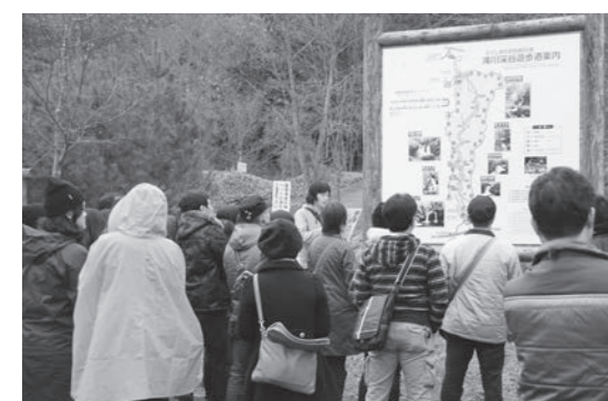
滝川溪谷入口で説明を受ける参加者たち