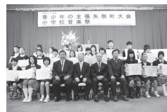
今大会で各賞に輝いたみなさん