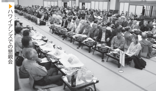
▶ハワイアンズでの懇親会