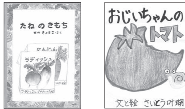
一般の部・家族の部最優秀賞作品