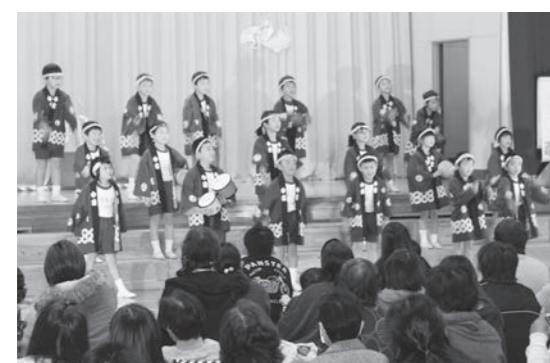
素晴らしい発表を見せてくれた東館小の子どもたち