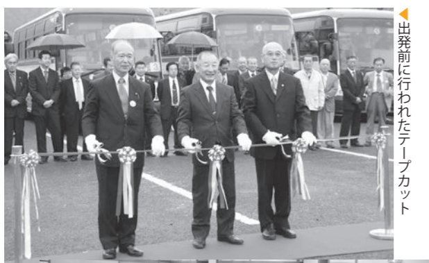
▲出発前に行われたテープカット

ハワイアンズでは、参加者243名が一堂に会し懇親会が行われた後、温泉入浴やフラダンスショーなどを楽しみ、参加者同士が会話を弾ませ和やかな親睦交流を図りました。