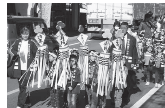
町内を行進する子供たち

11月5日(木)、やまつりこども園幼年消防クラブによる防火パレードが実施されました。こども園を出発した子供たちは、商工会、役場前を通り東館駅からこども園へ戻るコースを歩き、「私たちの町から火災を出さないようにしましょう」と町内の火の用心を呼び掛けていました。