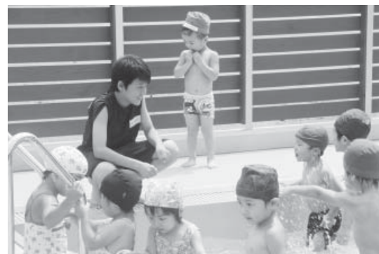
活動に参加した中学生とこども園の園児たち

7月22日～8月6日までの期間で、中高生によるサマーショートボランティアスクールが開催されました。期間中、やまつりこども園幼児教育部・保育部、ユーアイホーム、せせらぎ荘、石井小学校児童クラブ、カンガルーくらぶの6か所においてボランティア活動を体験しました。