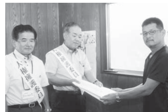
啓発品を渡す人権擁護委員の方々

7月28日、人権擁護委員による人権啓発活動の企業訪問が行われました。この活動は、男女共同参画による啓発活動の一環であり、毎年町内の企業2社の訪問を行っているものです。本年は、丸イ食品株式会社と株式会社須藤製作所を訪問し、人権擁護の趣旨を伝え啓発品が配布されました。