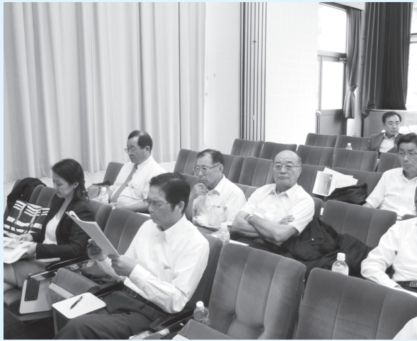
熱心に講演を拝聴する各議員