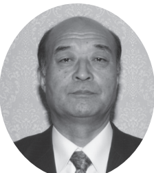
※任期は、平成27年5月12日から平成28年3月30日まで。

◎社会保障・税番号制度（マイナンバー）の実施における安全性の確保を求める意見書（発議第5号） ※可決した意見書を政府関係機関に対し送付しました。