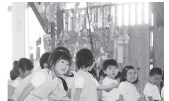
「七夕会」に参加する園児と笹飾り

7月7日、やまつりこども園で「七夕会」が開かれました。全園児が遊戯室に集まり、「7月7日」が何の日かの説明や「きらきら星」の歌などの催し物が行われていました。また、遊戯室には2本の大きな笹飾りが設置され、園児一人一人の短冊が飾られており、さまざまな願い事が書かれていました。