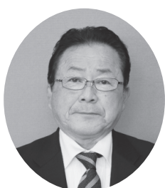
※任期は平成27年5月13日から平成31年5月12日まで

◎副町長の選任（議案第65号） 地方自治法第162条の規定により、議会の同意を求めるものです。