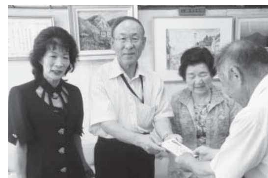
寄付に訪れた皆さん