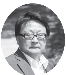
※任期は平成27年5月13日から平成31年5月12日まで