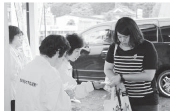
東館駅前での啓発品配布

身近な情報を寄せてください。自立総務課総務グループ TEL 0247-46-3131 FAX 0247-46-3155