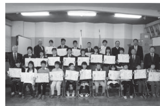
表彰を受けた子どもたち

3月3日、若鮎チャレンジサポートの表彰式が行われ、文化やスポーツで活躍した児童生徒に表彰状と記念品（図書券）が贈られました。今年度は若鮎大賞に12人、若鮎準大賞に12人の計24名を表彰。町長は挨拶の中で「さらに勉強やスポーツを頑張ってください」と今後の活躍に期待を寄せました。