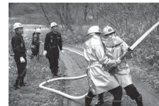
火点に向け放水する団員

3月1日、東白川郡内消防団や棚倉消防署などによる合同火災防御訓練が大井の滝川溪谷遊歩道付近で行われました。この訓練は大規模林野火災時を想定し、円滑な消火活動ができるようにと2年ごとに郡内持ち回りで実施されています。消防団はもしもに備え速やかな消火訓練を展開しました。