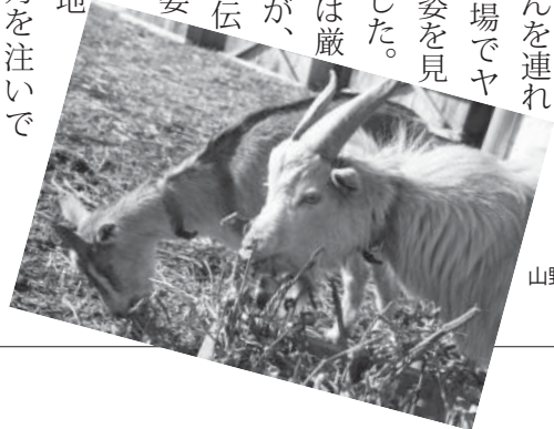
山野井・金沢明鳴会の山羊

耕作放棄地の現状は厳しいものがありますが、農村の原風景を守り伝えていくのも農業委員会の仕事と考え、今後も微力ながら地域農業振興のため力を注いでいきたいと考えております。