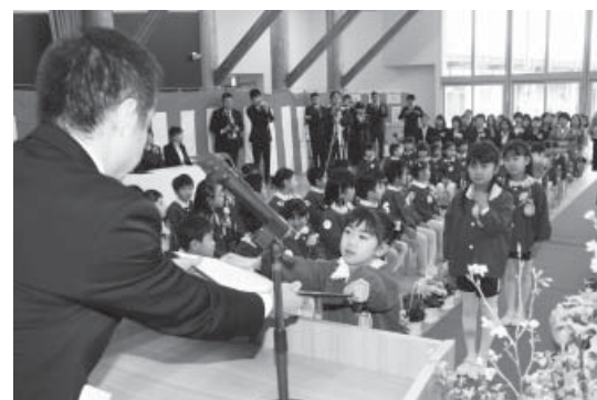
修了証書を受け取る卒園児

3月19日、やまつりこども園で修了証書授与式が行われ、幼児教育部の男子16名、女子24名の元気な子どもたちが、やまつりこども園1期生として卒園しました。保護者の前で「ありがとう」と感謝の気持ちを声に出し、小さな子どもたちが園生活を通して大きく成長した姿を見せました。