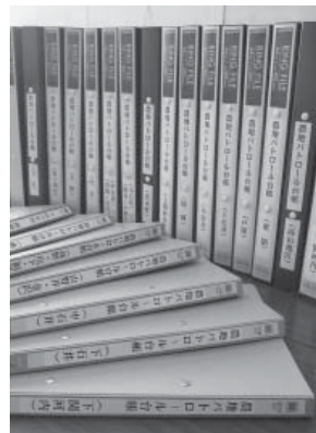
農地パトロールの成果をまとめた台帳

解消に結びつくと思われる農地、③人家や道路に近く、景観作物などの栽培を行うことが、町民の福祉向上に結び付くと思われる農地を中心に調査を行い、野帳を取りまとめました。その結果については、さっそく事務局で冊子化を行いました。今後の耕作放棄地解消に生かして行きたいと思ひます。