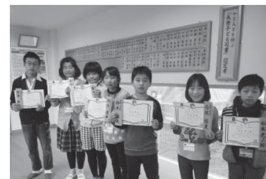
認定された7名の子どもたち

3月1日、第六期「矢祭子ども司書」講座の認定式が行われました。認定を受けた子どもたちは昨年6月から15回の講座を受講。今後は学んだことを活かして、学校や地域で活動することが期待されています。また、活発に活動した子ども読書推進リーダー6名にも奨励賞が贈られました。