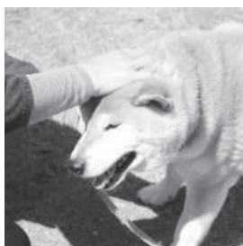
よくできましたと飼い主さんが褒めてくれました。次の指示はなにか…。