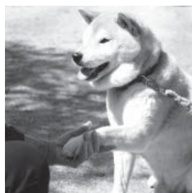
お手しましたよ、飼い主さんが褒めてくれたのか。おやつかな…。