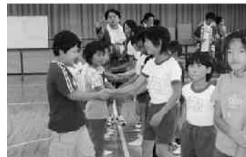
試合前の友好的握手