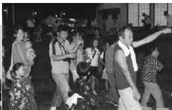
踊り込むお父さん