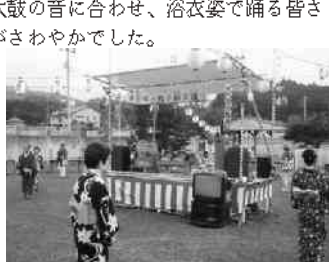
仮設ステージも準備完了