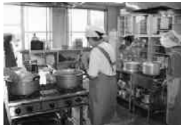
ボランティアによる昼食準備