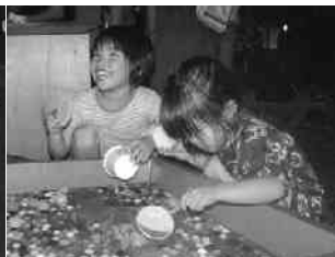
緑日気分に入る子どもたち