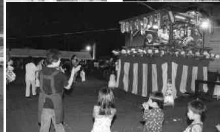
やぐらを囲む踊りの輪