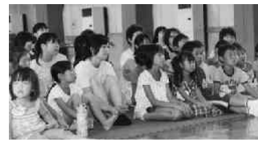
じっと見つめる子どもたち

福島大学児童文化研究会の講話による、大きな絵本の読み聞かせと紙芝居が、8月9日に山村開発センターで行われました。 会場となった大会議室には40名の幼児親子と学生が座り込み、童話部員が上演する紙芝居に食い入るように見つめていました。