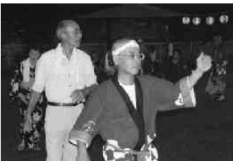
太鼓の音に合わせて踊る参加者