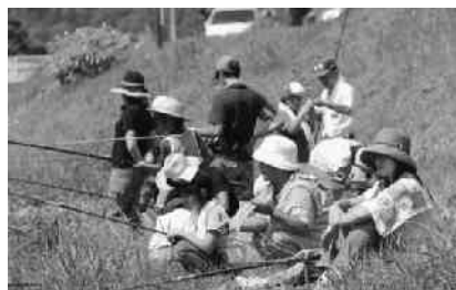
早く釣れないかな〜?