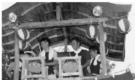
心身共に燃えた太鼓打ち