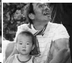
ボクもパパと親戦