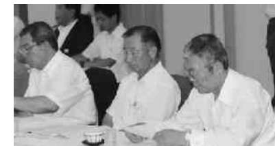
資料に目を通す町長（中央）