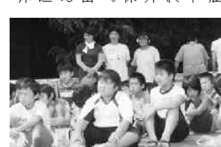
挨拶を聞く子どもたち