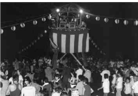
やぐらを囲む大勢の住民

8月16日には第16回目となる下石井盆踊り大会が、下石井多目的集会所前広場で行われました。区民の皆さんをはじめ、帰省客も交えての賑やかな盆踊りが行われ、大人も子どもも楽しい一夜を過ごしていました。