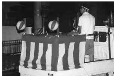
区内を一巡太鼓の音