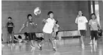
元気いっぱいのプレー