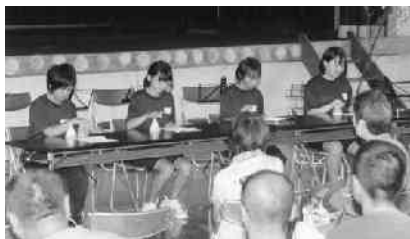
ベルハーモニーの演奏