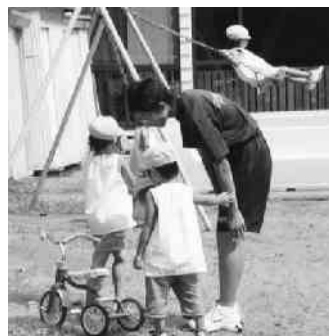
保育所にて(幼児との遊び)