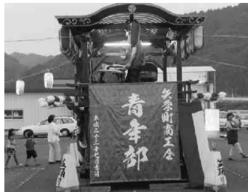
盆踊りを支える商工会青年部

昨年からはまったユーバル矢祭を会場にした盆踊り大会が、8月14日に駐車場広場で賑やかに行われました。東館地区の皆さんや帰省客が大勢参集し、やぐらを囲む踊りの輪に、太鼓の音と夜空を焦がす花火の音、そして鮮やかな光がこだましていました。