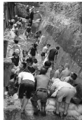
子どもたちの歓声は地域の宝