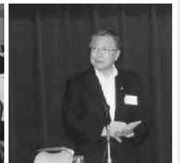
挨拶する佐藤知事