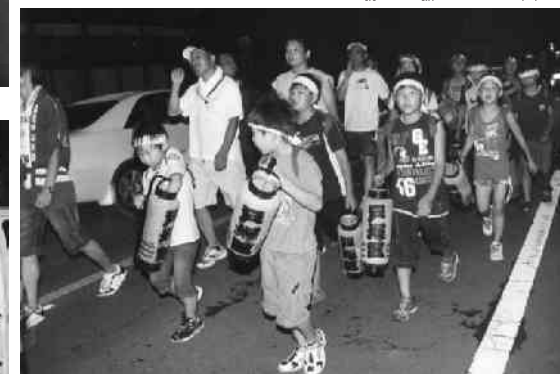
区内を練り歩く子どもたち