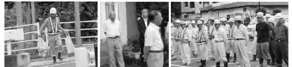
ごみ拾い作業（小田川地内）