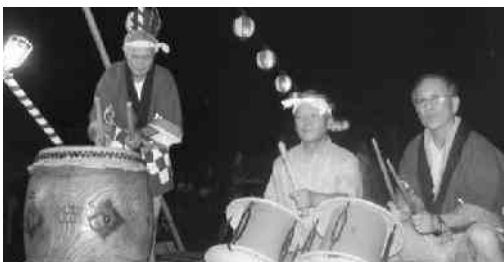
大太鼓、小太鼓の音も軽やかに

同じく15日、ニュータウン中山区でも賑やかにふれあい盆踊り大会が行われました。集会所前広場には、夜店も並び、緑日気分に入る子どもたちの笑顔と元気な声がありました。会場内には響き渡る太鼓の音に合わせて、浴衣姿で踊る皆さんの笑顔がさわやかでした。