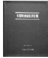
平成22年3月 矢祭町防災会議

これらから、町の地域防災計画 書も見直しが必要となり、平成21 年度改定作業を行ない、このほど 完成いたしました。これにより万 一の災害時に実効性のある対応体 制の確立や減災害対策の強化が図 られます。