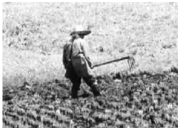
“まんのう”での田起こし作業(追分地内)