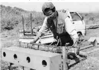
シイタケの植菌作業(下関河内地内)