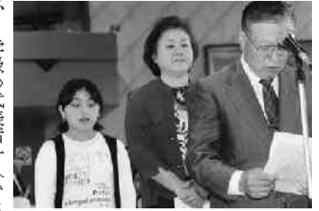
代表者の誓いのことば

5月8日に小学1年生から82歳の高齢者 に至るまでの老若男女が一同に会し、生涯 学習合同開級式が山村開発センターで開催 されました。開級したのは、小学生とその 保護者68名が参加した「ふるさと探検隊」 と6団体28名が加盟する「女性団体連絡協 議会」そして高齢者89名が参加した「平成 大学」の3学級です。