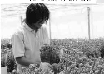
鉢花出荷作業(高野地内) 母の日を前に大忙し