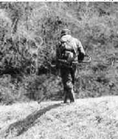
土手の草刈り作業(大垣地内)

5月に入り農家の皆さんは、田植えの準備や田植え作業が本格化し、また畑作も始まり忙しい毎日が続きました。皆さんの願いは“豊年満作”です。町内各地の農作業のようすをカメラで追ってみました。