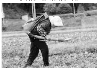
肥料撒き作業(関岡地内)