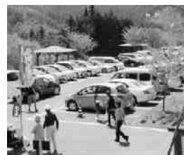
大拱駐車場の様子