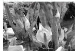
水芭蕉も見頃でした

十割そば、手打ちうどんなどを食べながら、疲れを癒し、矢祭町での有意義なひとときを過ごしていました。