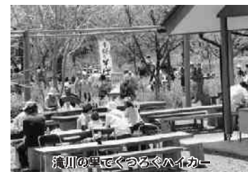
滝川の里でぐるぐるハイカー

農産物直売所「太郎の四季」では、連休中の休みの日、1日に刺身、1日にの試食販売会や新鮮野菜などのプレゼント、2日には臼と杵による餅つき大会、3日は新鮮卵をゲットやJA女性部のパザーなどが行われました。また壺元の素焼きの美濃販売コーナーや回転焼き・バナナの叩き売りなど多彩な催しが行われ、駐車場には県内外ナンバーの車が入れ替わり駐車し、連日賑わいを見せていました。もちろん、新鮮な春野菜や旬の山菜なども豊富に並べられ、都会から来たお客さんはお土産にとたくさん買い求めていました。矢祭山公園も大勢のお客さんが立ち寄り、咲き始めたツツジや奇岩怪