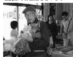
茨城県から来たお客さん 直売所でお土産をどっさり