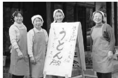
矢祭山でのボランティア 観光客への軽食提供

石を眺めながら、鮎の塩焼きや串だんごを口にしていました。また友情の森売店では、観光客の皆さんに軽食を提供しようとする町の女性ボランティアの皆さんが、うどんや焼そば、ところ天などを格安で販売し、訪れたお客様に真心のサービスをしていました。