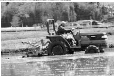
代かき作業(下石井地内)