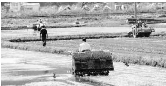
耕起・代かき・田植え作業(下石井地内)