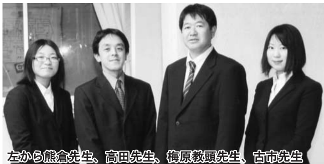
左から熊倉先生、高田先生、梅原教頭先生、古市先生