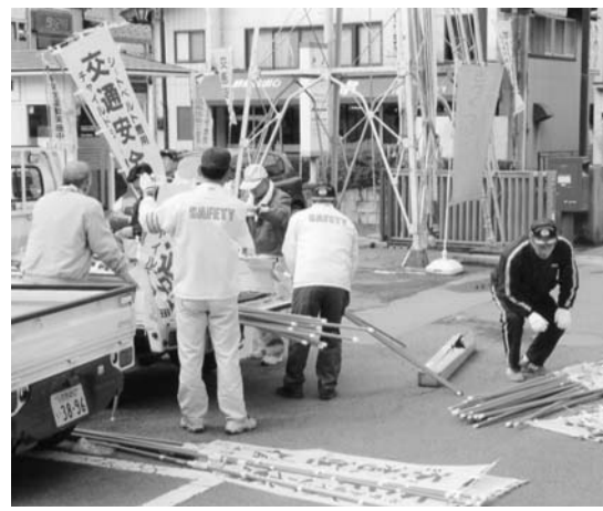
のぼり旗を準備する役員

春の全国交通安全運動に入る前に、棚倉地区交通安全協会矢祭支部役員の皆さんが注意喚起する旗の準備作業に追われ、陰での奉仕作業に汗を流していました。役員皆さんの思いは交通事故ゼロです。