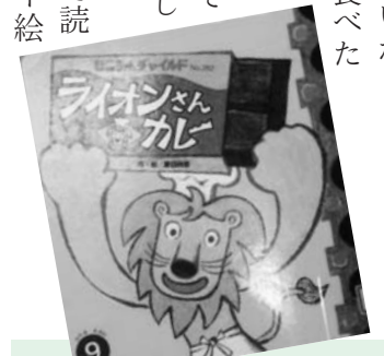
「ライオンさんカレー」 (E-ナ) 作・絵 夏目尚吾 出版社 チャイルド本社

「もったいない図書館」はいつも家族で楽しく利用させていただいています。絵本が大好きな娘たちは、毎日寝る前に必ず「今日も読んで」と絵本を持って来ます。私にとって読み聞かせの時間は、子どもと向き合い、ゆったりとした気持ちで過ごせる大切なひとときとなっています。 今回、私のお奨めする本は「ライオンさんカレー」です。ライオンのコックさんと一緒にカレーを作るお話で、「玉ねぎをいためて・・・」「カレールウを入れて・・・」と絵本の中からカレーの匂いがしそうな、何だかカレーが食べたくなるような気分になれます。どんなカレーライスが出来上がるのか。それは絵本を読んでものお楽しみ♪