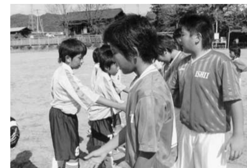
試合後は相手と握手