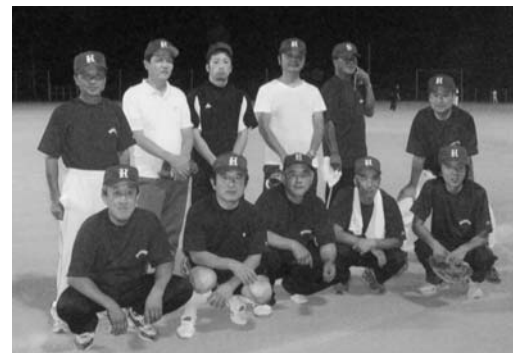
ナイターソフトボール大会にて

また、今年で39回目を迎える区民ソフトボール大会も継続しています。まさに「継続は力なり」で、若い人たちはぜひ体協に加入してください。