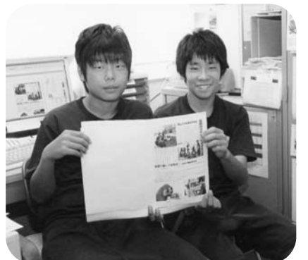
広報づくりに挑戦