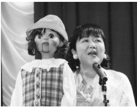
わがしさんの腹話術