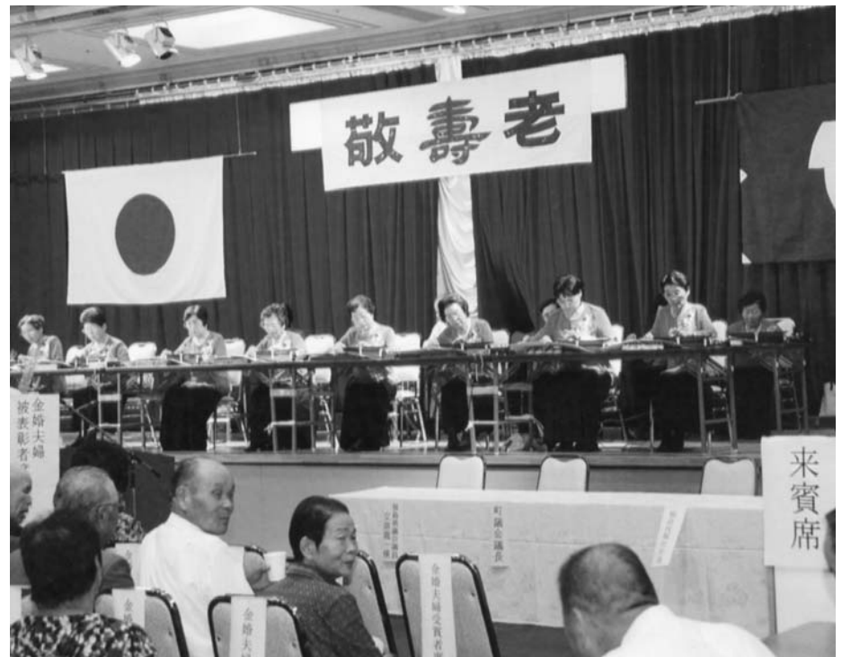
J A矢祭大正琴クラブの演奏