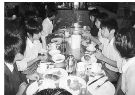
レストランでのディナー