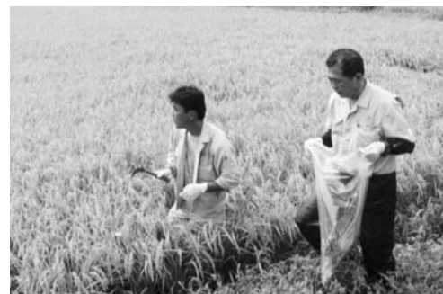
試料用稲穂の採取

9月5日、町はコシヒカリなど一般米の収穫の前に、コメの放射性物質予備調査を実施しました。調査は、県のモニタリング検査の一環として行われたもので、試料玄米は町内5地点(旧石井村2・旧豊里村2・旧高城村1)から採取しました。 採取した玄米は、県農業総合センターで検査を実施し、放射性物質の有無が確認されました。その結果、調査地点の玄米からは放射性物質が検出されなかったため、続く本調査は、旧村単位で2点ずつの採取で実施されました。 さらに9月16日には、収穫したコメの放射性物質に関する本調査が行われましたが、町内6地点のコメからは放射性ヨウ素及び放射性セシウムが検出されず、安心して出荷できることになりました。 この結果を受け、町では検査結果について証明するチラシを作成いたしましたので、ご希望の方は役場窓口でお受け取り下さい。