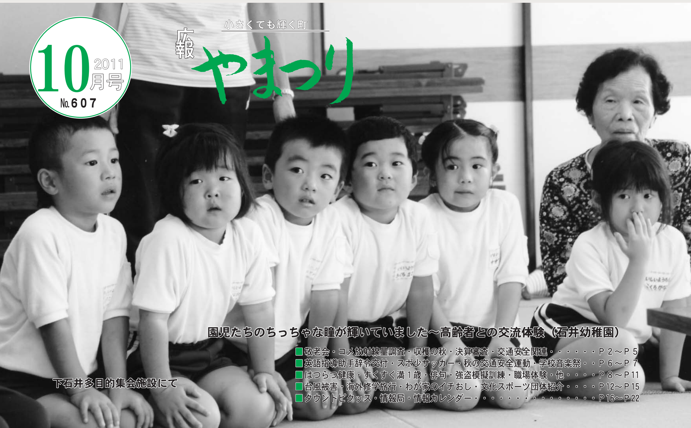
園児たちのちっちな瞳が輝いていました～高齢者との交流体験（石井幼稚園）