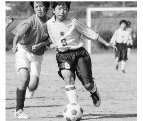
ボールの奪い合い

〈試合結果〉 優勝 東館スポーツ少年団 準優勝 関岡スポーツ少年団 3位 石井スポーツ少年団