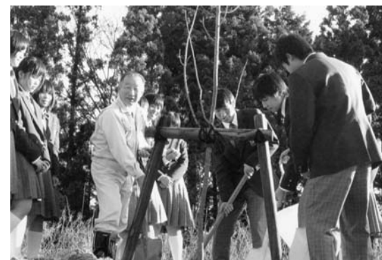
昨年度の緑の郷づくり事業

次に、平成23年度事業計画と事業予算について説明が行われ、協議した結果、いずれも原案のとおり承認・決定しました。