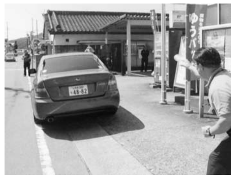
逃走車にカラーボールを投げる局員

訓練は、帽子をかぶりマスクをかけた警察官扮する強盗犯が、突然、刃物を振りかざし郵便局ロビーに進入。ガソリンが入ったペットボトルを手に、「撒き散らすぞ」と威嚇しながら、「金を出せ」と局員にバッグを差し出し、現金が入れると、すばやく奪い取り逃走。局員がすぐ追いかけ、走り出した車にカラーボールを投げつけ110番通報。