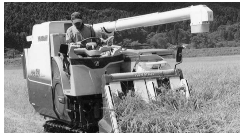
収穫作業(戸塚地内)

9月に入り収穫期を迎えた各地の田んぼでは、稲刈り作業が盛んに行われました。東京電力福島第一原発事故による放射性物質がたいへん心配されましたが、県による専門機関での予備調査・本調査で町内のコメからは放射性ヨウ素及び放射性セシウムが検出されず、安心して出荷ができることになりました。 毎年このことから、農家の皆さんが八十八の手間をかけ、流した汗は今年も報われることになりました。