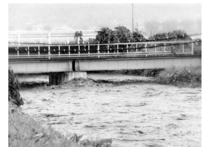
田川も増水し鉄橋まであとわずか