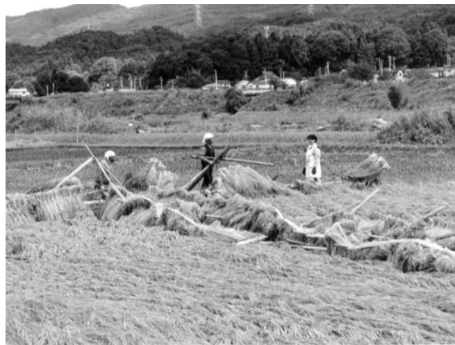
おだ掛けの手直し（天神沢）