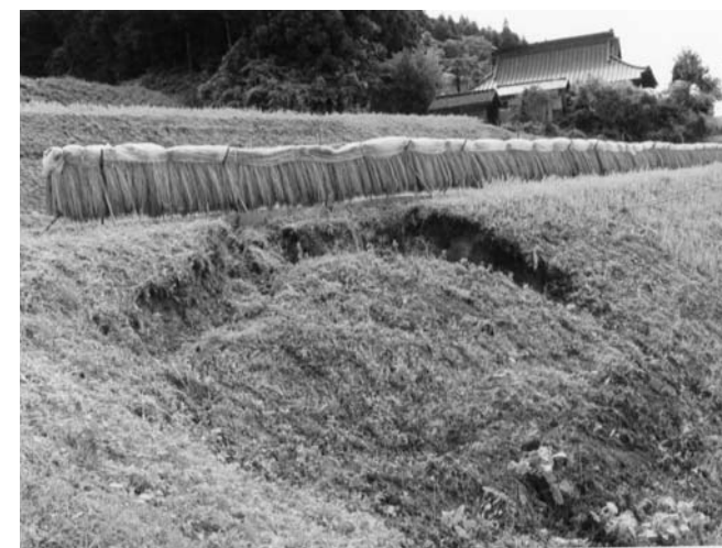
法面の崩壊（入宝坂）