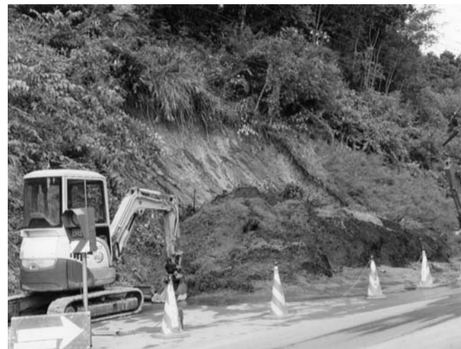
国道349号への土砂崩れ（小田川地内）