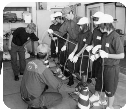
ロープ結索を学ぶ