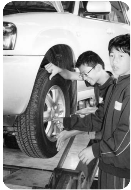
車のタイヤ入れ替え作業