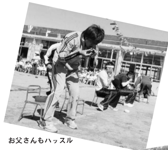
お父さんもハッスル