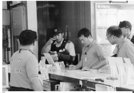
警察官による事情聴取

通報を受けた棚倉警察署からパトカーが駆けつけ、局員から事情聴取するとともに、犯人が茨城方面へ逃走したため、大子警察署へ緊急配備を依頼。両警察署が連携しながら犯人確保までの一連の訓練を実施しました。