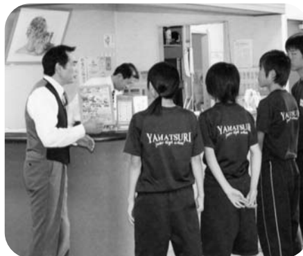
業務内容を聞く(ユーパルで)