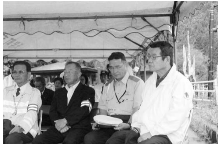
静かに安全祈願する町長ら