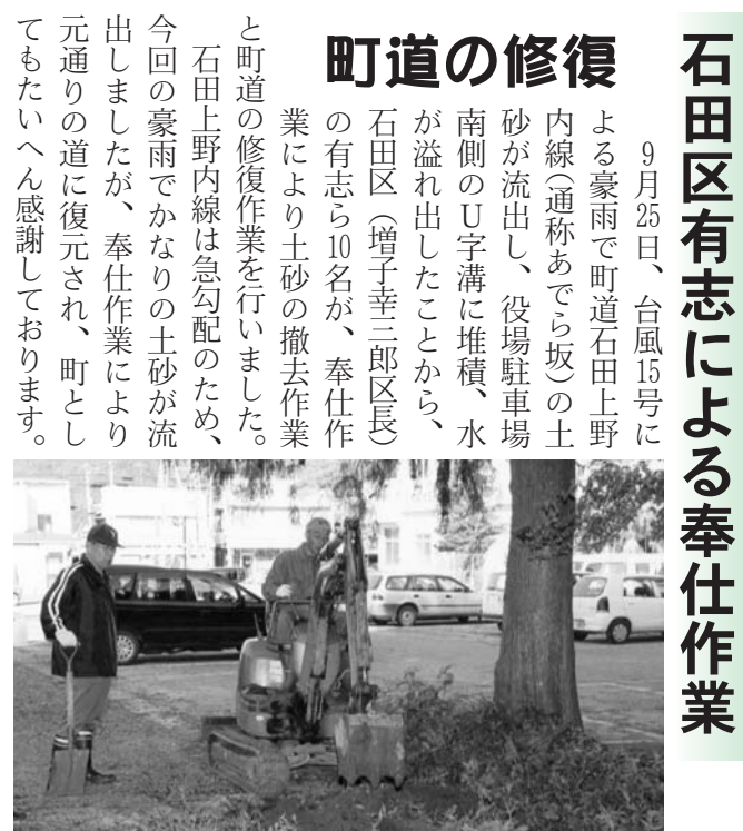
ミニバックホーでの土砂の撤去