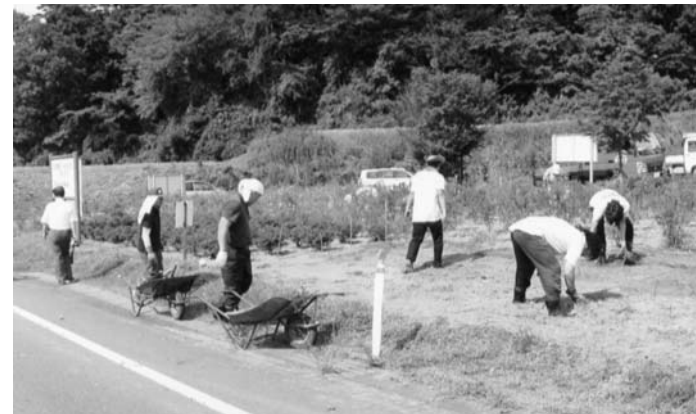
汗だくでの草むしり