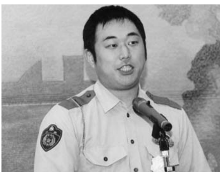
講話する花見巡査部長