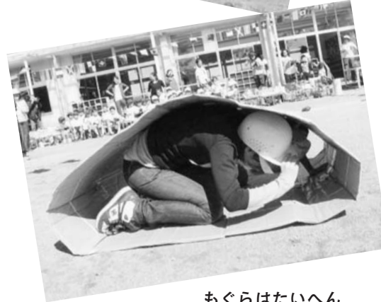
もぐらはたいへん