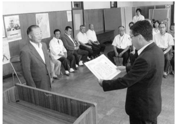
表彰状を受ける交通対策協議会長(町長)