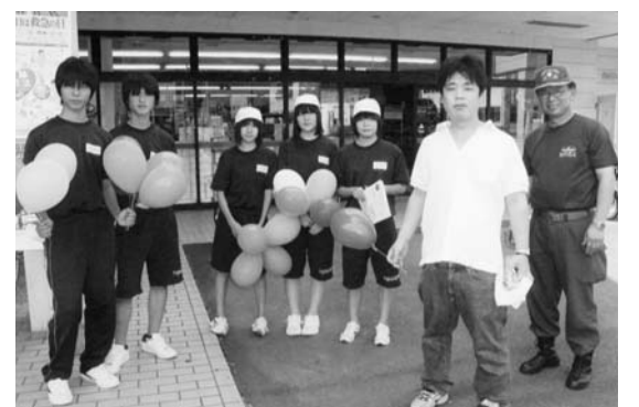
街頭広報する分署長と中学生

救急医療週間 9月4日から9月10日までの1週間は救急医療週間です。救急医療週間は、救急医療及び救急業務に対する国民の理解と認識を深め、救急医療関係者の意識の高揚を図ることを目的に毎年実施しています。 これに伴い、9月8日に棚倉消防署矢祭分署では、職場体験学習にきている中学生を交えて、リオンモール矢祭店前で街頭広報活動を実施しました。