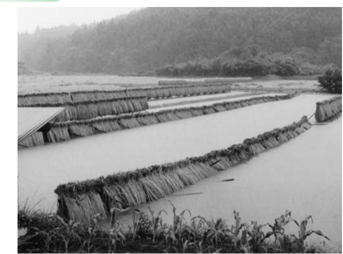
冠水した水田（江戸塚）