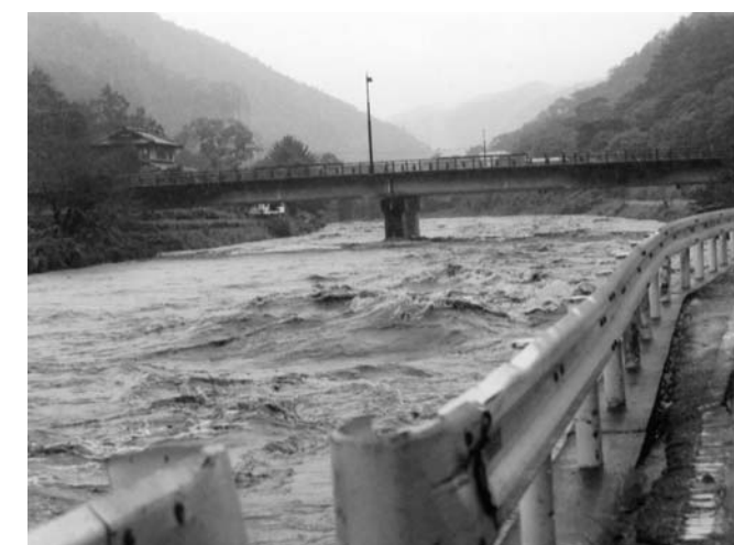
水かさを増す久慈川（矢祭山地内）

今回の豪雨被害は、特に関岡地区に多く発生し、水田への冠水で収穫目前の稲に泥がかぶったり、おだ掛けした稲束がそのまま流されたりと、農家にとっては大きな打撃となりました。