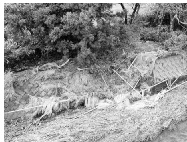
流されたおだ掛け（天神沢）