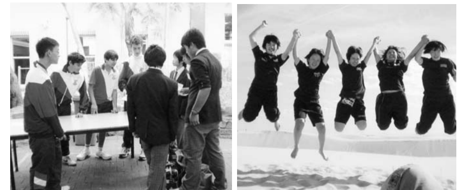
砂丘サファリでジャンプ!