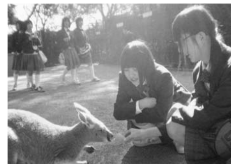
フェザーデール動物園