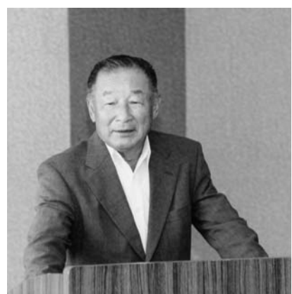
新たな決意を述べる町長

本町での交通死亡事故は、平成20年12月17日小田川字榎平地内で、歩行中の79歳女性が車にはねられた事故を最後に、ゼロ記録が継続しています。過去には交通死亡事故ゼロ1千日を4度達成していますが、今度こそ死亡事故ゼロ記録を2千日、3千日と続けられるよう全町民挙げて、交通安全に努めましょう。