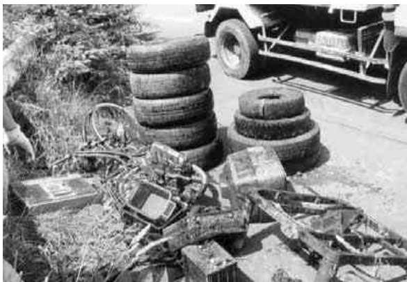
不法に捨てられた廃棄物

町民福祉課生活環境グループ TEL 4 6-4 5 7 4 榎倉警察署 TEL 3 3-3 2 4 1