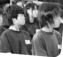
じっと見詰め続ける生徒