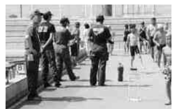
避難した利用者と指導した分署員

7月16日午後2時、スインピア祭の火災警報器が鳴り出し、「機械室ポイラーが燃えています。火災です。」利用者は職員の手指示に従って、緊急避難してください。」と館内放送が流れました。泳いでいた利用者はすぐ水から上がり、監視員や管理人の指示に従いながら避難場所へと移動しました。