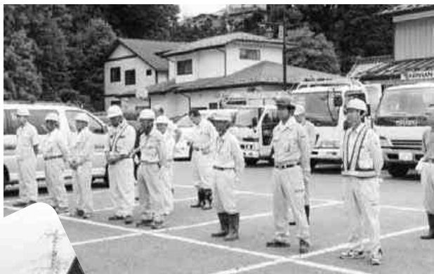
回収作業に当たる従業員と町職員