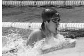
ゴールめざし必死の泳ぎ

第54回福島県中学校体育大会県南中学校水泳競技大会が、6月22日にスインピア矢祭室内プールを会場に開催されました。この大会には、東白川・西白河・石川郡内16の中学校から103名の選手と競技役員が参加し、8種目30競技に熱戦が繰り広げられました。本来であれば屋外公認50mプールで行う予定でしたが、福島第一原発事故による放射線の影響を心配し室内プールでの開催となりました。