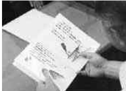
冊子に目を通す町長