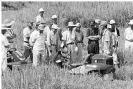
熱心に説明を聞く参加者