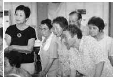
作り方をじっくり見学