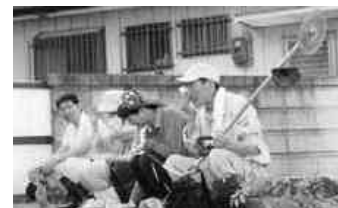
作業を終えた後のひと休み