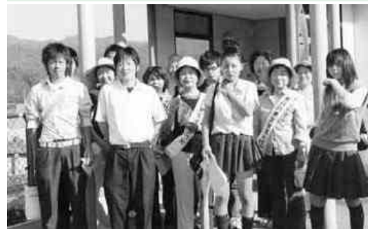
運動に参加した皆さん（磐城石井駅）