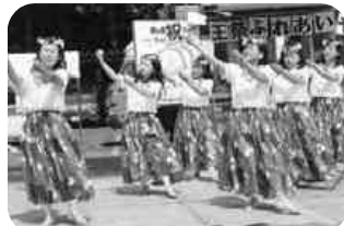
トロピカルなハワイアンダンス