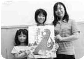
矢祭もったいない図書館利用者

エルマーの機転に大笑いしながら夢中になって子どもと一緒に読みました。キャラクターやチューニングゲームをどう使うかな？ぜひ読んでみてください。