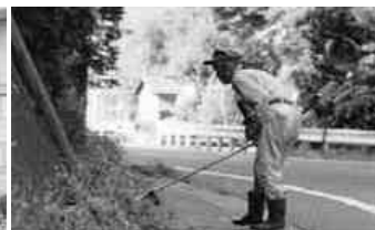
国道脇を一人で黙々と草刈り

7月3日早朝、全21区が1戸1名の協力をお願いし、町内一斉のクリーンアップ作戦が実施されました。毎年実施している恒例行事で、河川や道路、堤防、公園や集会所などのゴミ拾いや草刈り作業などに汗を流しました。