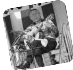
ソロギターのジャズ演奏