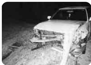
飲酒運転による悲惨な車両

ドライバーの皆さん、「乗るなら絶対に飲むな」「飲んだら絶対に乗るな」を自身にしっかりと聞きかせてください。