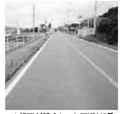
▲縁石が低くなった国道118号

改修の予定は、塩素水による銅板の金物類の腐食がひどいため男女トイレ等の建具取替、25mプールサイドのグレー