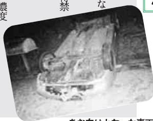
あお向けとなった車両

呼吸検査結果 0・25mg/リットルのアルコール濃度 検知の場合25点（即免許取り消し、免許取得禁止2年） 呼吸検査結果 0・15mg/リットル、0・25mg/リットル未満のアルコール濃度 検知の場合13点（即免許取り消し、免許停止90日） 違反点数については、それまでに何点か違反点数が加算されていると、さらに罰則が重くなる場合があります。