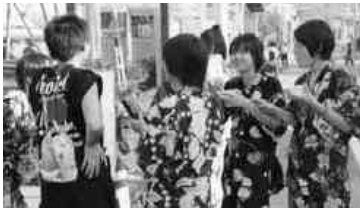
緑日気分に乗る子どもたち