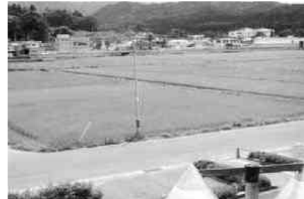
▲提案されたユーバル矢祭前の水田

小学校を統合して、1中学校、1小学校とし同一敷地内に建設をする。建設場所は水都緑東館駅の西側、ユーパルの間の水田敷地面積は10町歩、建設する建物は小中学校の校舎それに付随する建物。グラウンドは多目的広場とし400mトラックが確保できる広さ、プールはスインピアを利用、その隣にテニスコートがあり、図書館はもったいない図書館を利用してはどうか。