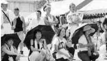
よさこい踊りに見入るお客さん