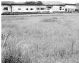
▲子どもセンター建設予定地

祭では、町内の業者、商店の利用が余りないと聞いております。今、原発事故による風評被害でどこでも大変なときであります。これを機会に地産地消、新鮮で安全・安心な野菜、また、商店を利用することで町の活性化、商店の育成につながるのではないかと、町の考えをお伺いします。