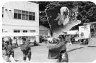
勇ましいよさこい踊り隊