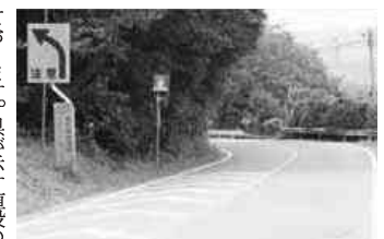
▲解消されない山野井地内のカーブ

ております。県が示す値段の数十倍高い法外な値段を要求され話し合いが進まない現状であります。