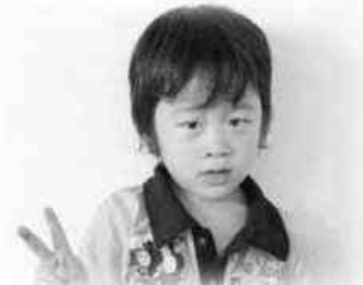
ボク、むし歯になんか負けないもん!

3歳を過ぎると、乳歯でのかみ合わせがようやく完成し ます。この時期は子どもの食べる様子を見ながら、適度に 噛み応えのある食品を取り入れていきましょう。