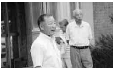
出発式で挨拶する町長