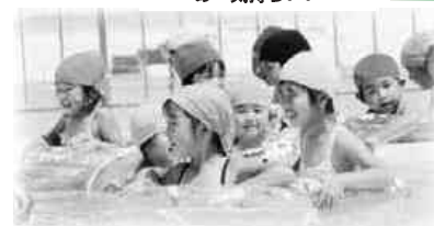
初泳ぎに歓声あがる

着替えをした園児たちは、先生の指導で準備体操を済ませ、まずシャワーで体を水に馴染ませました。そして、浮き輪を抱えてプールに入っていくと、水の冷たさに「キャー、キャー」と次々に歓声を上げていました。 この日も猛烈的な暑さで、たちまち水に馴れた園児たちは元気に遊び回っていました。