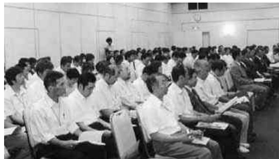
熱心に聴講する参加者