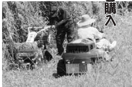
試乗し性能を確認

し、その使い勝手を確認しました。なお、使用するに当たっては危険を伴うため、十分注意するようまたメンテナンスもしっかり行うよう呼びかけています。 貸し出しを希望する方は、JA東西しらかわ矢祭支店(TEL4613145)又は東部営農センター(TEL431141)に申し込みしてください。