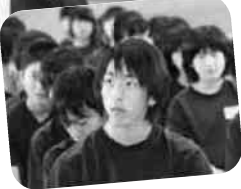
真剣に聞き入る生徒

※「ダルク」とは、覚せい剤、有機溶剤（シンナー）、市販薬、その他の薬物から開放するためのプログラムを持つ民間の薬物依存症リハビリ施設をいいます。