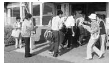
人権擁護を呼びかけ

「社会を明るくする運動」とは すべての国民が、犯罪や非行の防止と罪を犯した人たちの更生について理解を深め、それぞれの立場において力を合わせ、犯罪のない地域社会を築こうとする全国的な運動です。