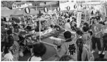
お祭りムード一色