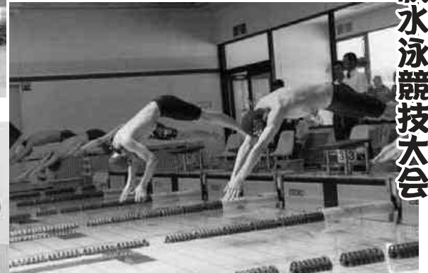
きれいに一斉スタート！