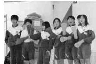
母校選手に声援を送る