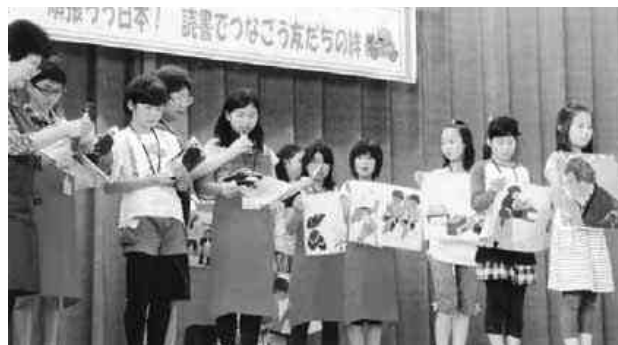
読み聞かせをする子どもたち

市長をはじめ全校児童と保護者約300名が集まりました。そんな中で子ども司書たち全員で、手づくり絵本コンクールで最優秀賞に輝いた「チクチクおばあさん」の読み聞かせを行いました。読み聞かせが終わると、瑞木小の読書ボランティア「絵本の会」からは、地元民話の読み聞かせが披露され、読書を通じたお互いの交流が深まりました。参加した子ども司書からは「本之力を再認識しました。広野小のみんなが早く帰れることを信じたいです。」との感想が聞かれました。