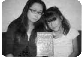
矢祭もったいない図書館利用者