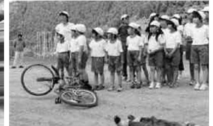
状況説明を聞く児童たち