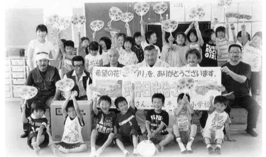
全員で「ハイポーズ」