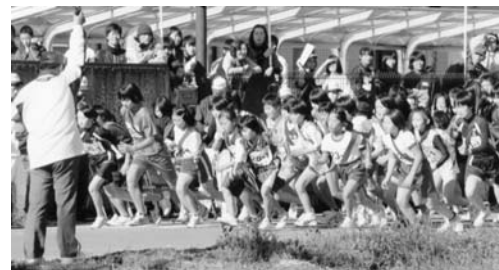
スタートダッシュ