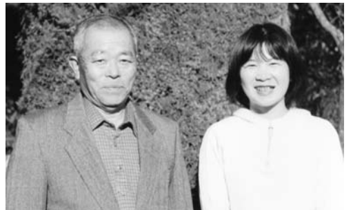
親子で卯年です。照れますね！

迎えるペースも、何か故か段々早く感じるのせいで、昨年、子育てや仕事に日々忙しく過ごしてしまった感があります。今年も気持ちにゆとりを持って、子供たちを見つめてあげたいです。そして、何よりも「健康第一」で、家族みんなが楽しく過ごせたらいいなと思います。