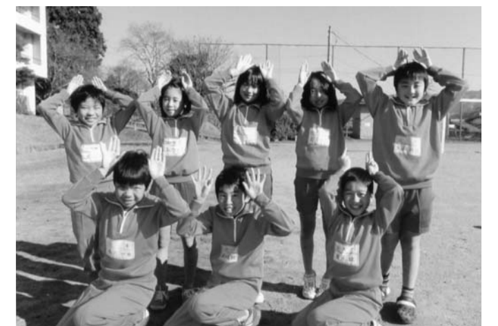
みんな、僕らの活躍に赤丸チェック!!

待っていました。うさぎ年！いよいよ僕らの干支が主役。12年に1回しかない今年に、たくさんの楽しい思い出を作るピョン！運動に勉強にいつも元気に一所懸命に取り組み、途中でカメさんに抜かれぬぞ。今年1年、僕ら関岡ラビット8人衆はより良い1年をかけぬけます。