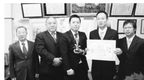
受賞報告する商工会青年部

KFB福島放送主催の2010ふくしまふるさとCM大賞の審査会が、12月4日に郡山市の郡山開成学園で開催され、矢祭町から応募した商工会青年部制作の「矢祭町大捜査線」が、演技賞に輝きました。その副賞として、2月1日から10月31日までの期間に福島放送で、「矢祭町大捜査線」CMが30回にわたり放送されることになりました。町民の皆様もぜひ一度ご覧ください。