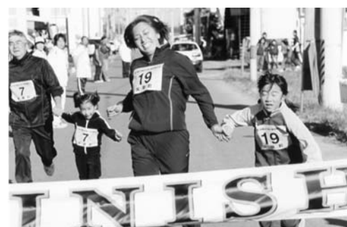
歯を食いしばりゴール