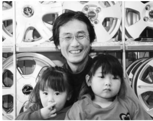
孫と一緒にパチリ！

明けましておめでとうございます。いつの間にか気づいたら還暦！卯年が5回巡ってきました。健康な5人の孫に恵まれ、毎日、幼稚園、保育所の送迎を忙しい中でも楽しく、ジョークを言い合いしながらしています。40歳の時、趣味半分で始めた商売も何とか皆様の支えがあり、お蔭様で頑張っております。よくお客様から「孫は責任ないから、可愛がるだけだから、楽だよ」と聞きますが、私にはそうは思えなくて、わが子よりも責任重大！勝手にECCジュニアに入れたり、図書館に連れて行ったりして、将来の楽しみに頑張っています。孫がいるから頑張れる還暦男です！