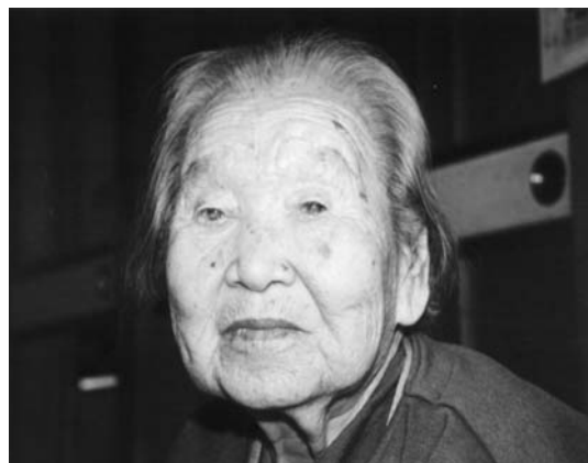
お肌つるつるのイクさん

何でも食べるし、嫌いなものもねえし。生かしてもらっているだけで幸せだよ。みんなありがとう。