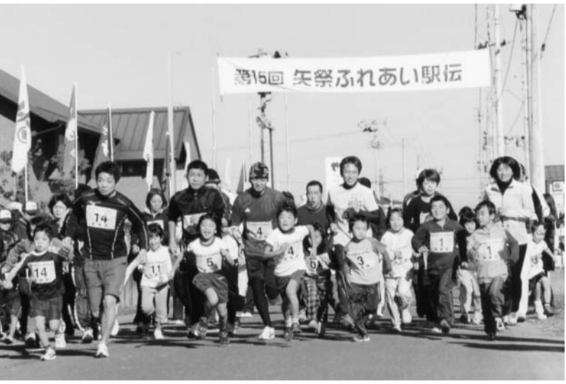
一斉スタートする親子の部