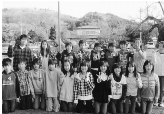
ラビットパワー、ジャンプでゴー!!

今年の3月には小学校を卒業し、中学生になります。そこで、勉強やスポーツなどの小学校でのまとめをしっかりして、中学生生活への準備をしようと思います。勉強の面では、ケアレスミスに気を付け、不得意な所は、自分なりに分かりやすくまとめ、自信がもてるようにがんばりたいです。生活面では、ルールを守り、規則正しい生活を送り、友達と仲良く過ごしたいです。そして、楽しい石井小学校の伝統を下級生につないでいきたいです。