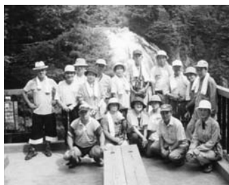
尾瀬の三条ノ滝にて

設立時の入水鍾乳洞から始まり、奥久慈男体山や尾瀬国立公園を中心に活動していましたが、現在は、富士山や北アルプス八ヶ岳など日本の名峰に出かけるようになりました。私たちハイキング協会は、自然に親しみ大自然の中での活動を通じて体力づくりを行うとともに、会員の交流交歓を図ることを目的としております。今年には富士山登山を計画しております。