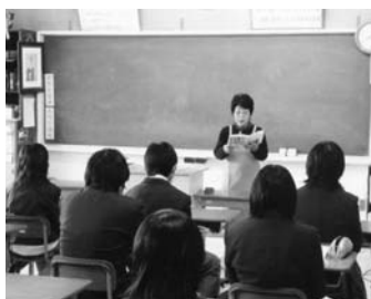
中学校での読み聞かせ

「読み聞かせから、自らの読書活動につなげていきたい」と子育て中のお母さん方と無償ボランティアをして10年。今、子どもたちの周囲には読書環境が整備され、嬉しい限り。「感動が心を育てる」を旗標に読書推進を図っている会です。