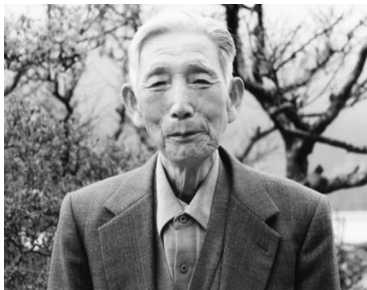
ゴルフに燃える年男

これからは、下手なゴルフを楽しみ、日課としてテレビ、特に時代物や大河ドラマを鑑賞し、水戸黄門等で肩をほぐし、犬の運動をし、1日のメとして晩酌を楽しむことにしています。人に迷惑を掛けない楽しい日々を過ごしたいと思ひます。私と