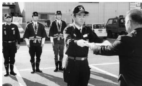
引渡し書を受ける団長