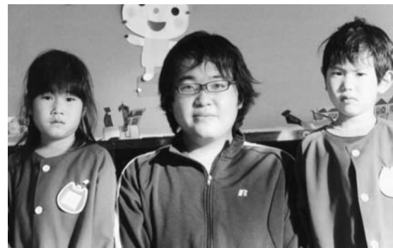
職場で園児とパチリ！

年でした。様々な人と出会い、生活環境も大きく変化した1年となりました。今年も健康に気をつけて、明るく元気に過ごすことができると思っています。年男だという実感はまだありませんが、12年に1度しかない年なので、1日1日を楽しんで有意義に過ごせるよう頑張りたいと思います。