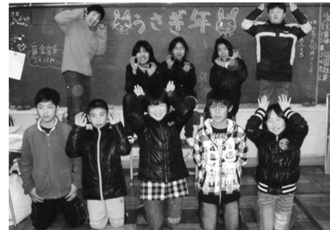
ハッピーラビット 未来へジャンプ!