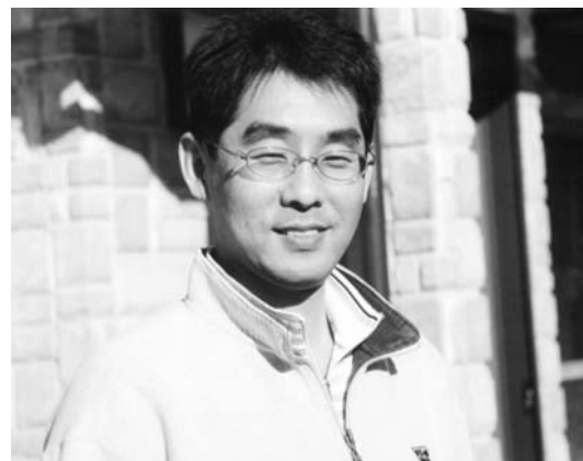
朝日が眩しい玄関先で

明けましておめでとうございます。町民の皆様にはご健勝にてお迎えのこととお慶び申し上げます。私も健康で6回目の卯年を迎えることができました。健康の秘訣は自分のペースで果実や野菜等を作っていることだと思っています。また、孫たちの動作や言葉にいつも笑いをもらっています。笑っている時はとても幸せを感じます。今年も自分なりに何事にも頑張っていこうと決意を新たにしました。