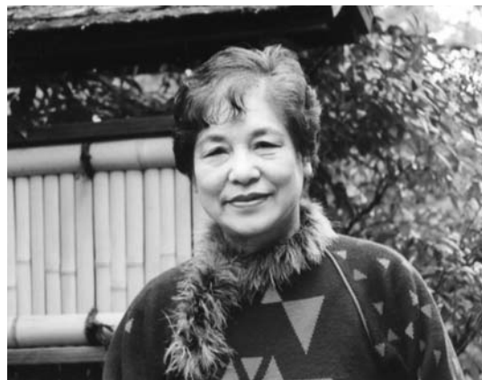
若いパワーをもらい元気維持

これからは健康に留意し、周りの人たちとの温かいおつきあい、そして夫婦茶碗でおいしい漬物とご飯。米や野菜づくりに「おかげ様で」の感謝の気持ちが続けたいと願っています。今年も良い年でありますように。