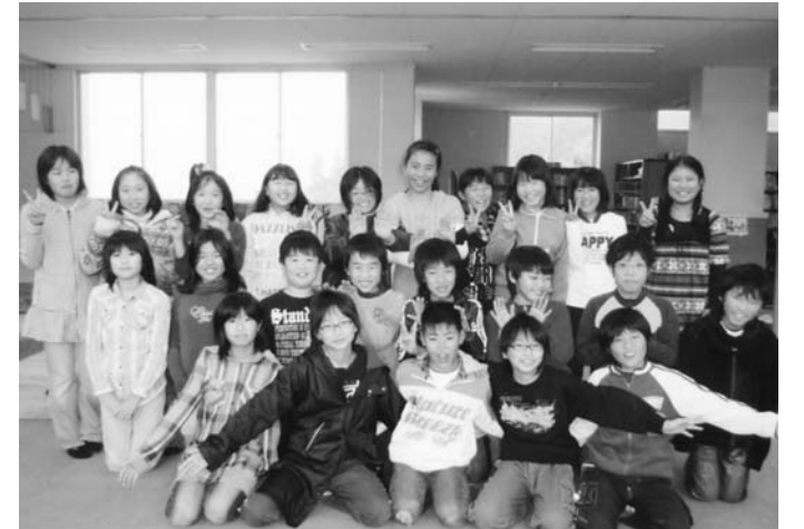
兎のごとくホップ・ステップ・ジャンプ！飛躍の年に

2011年はうさぎ年。私は年女です。今年は、小学校を卒業し中学校へ進学します。卒業まであとという間だと思いますが、6年生の勉強や6年間の復習、やらなければならない課題をしっかりとって卒業したいです。中学校では、勉強が難しくなり、部活動があるなど、今と違って大変なことがたくさんあるのではと少し不安もあります。でも、修学旅行などで仲良くなった、他の小学校の友達が増えたり、制服があったりという楽しみもあるので、頑張りたいです。