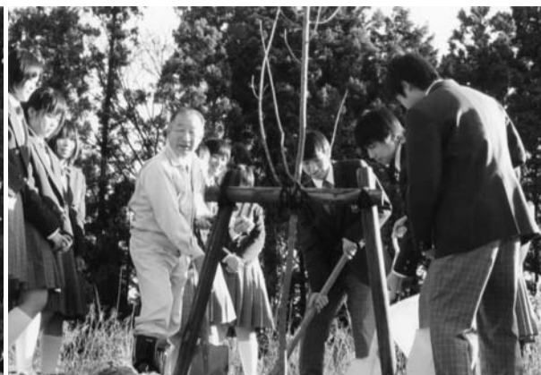
思い出に残る町長との植樹