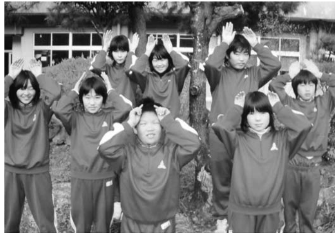
内川小学校卯年隊！スマイリ〜ラビッツだピョン♪