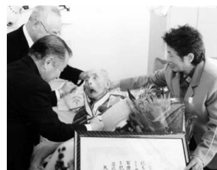
町長、記念メダルをかける