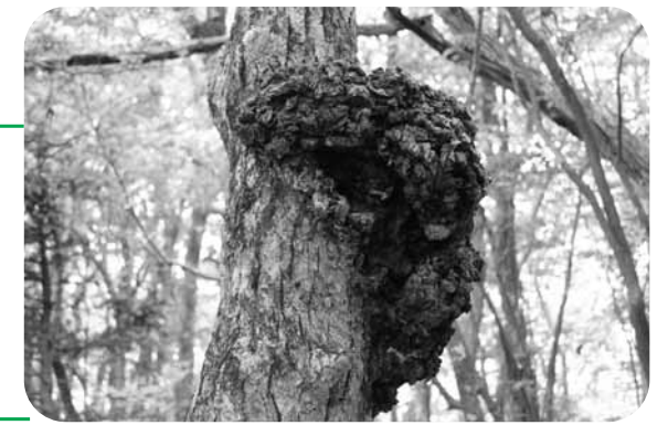
[略称] 当…当番医 山開…山村開発センター 塙…塙厚生病院

八溝山天然林を散策していると、木に何かいる！動物？よく見ると・・・木が長年の間で作り上げた芸術作品でした(笑) やはり自然の力はすごいですね。