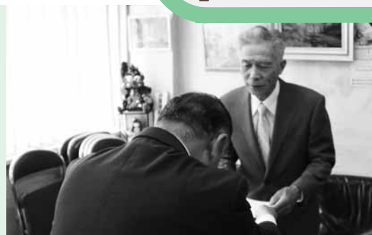
任命書交付のようす

5月24日、町議会は町が実施している道路災害復旧工事や各種事業など、町内視察を実施しました。 町内視察には、町長と各課長等が同伴し、それぞれの現場で担当課長や担当職員から事業の概要や進捗状況の説明が行われ、議員からもその都度質問しながら、事業内容の把握に努めました。