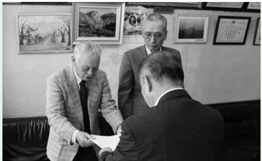
メッセージ伝達の様子

第55回福島県中学校体育大会 県南中学校水泳競技大会が、6月20日にスインピア矢祭室内プールを会場に開催されました。 この大会には、東白川・西白河・石川郡内19の中学校から155名の選手と競技役員が参加し、熱戦が繰り広げられました。 矢祭中選手は18名参加し、3種目の個人競技と女子400mリレーが県大会出場を決めました。