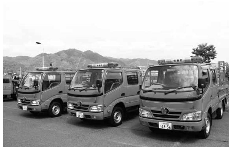
新鋭の小型動力ポンプ積載者3台

この天然林は2人の 志から始まった物語 60年経った今もなお 引き継がれているのです