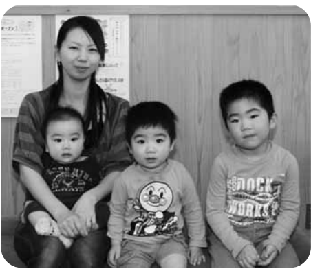
矢祭もったいない図書館利用者

わが家のイチおしの一冊は、誰もが知っている「ももたろう」です。 定番ではありますが、小さい子どもでもわかりやすいお話だと思います。 子どもが発音しやすい「もも」から生まれ、ご飯をいっぱい食べて、力持ちの少年に成長し、やがて、おにが島へおに退治に向かいます。その時お供するのが子どもたちもよく知る、いぬ・さる・きじ。登場する動物も馴染みのある動物たちで、悪いおにを退治する強くて優しいももたろうは、子どもたちのヒーローです。 まだ字が読めない子どもたちですが、毎晩聞いているうちに、本のページをめくりながら、ももたろうのお話ができるようになりました。