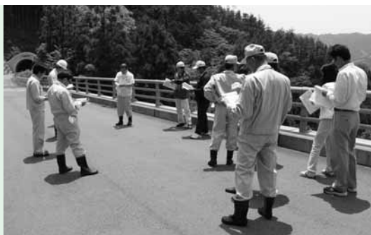
議員視察のようす

5月30日、矢祭町地域包括支援センターによる出前保健室が、JA農産物直売所「太郎の四季」駐車場で開設されました。 出前保健室には直売所に来たお客さんが立ち寄り、血圧や体重を計ったり、体脂肪率の測定を行ったりしながら、健康相談をしていました。