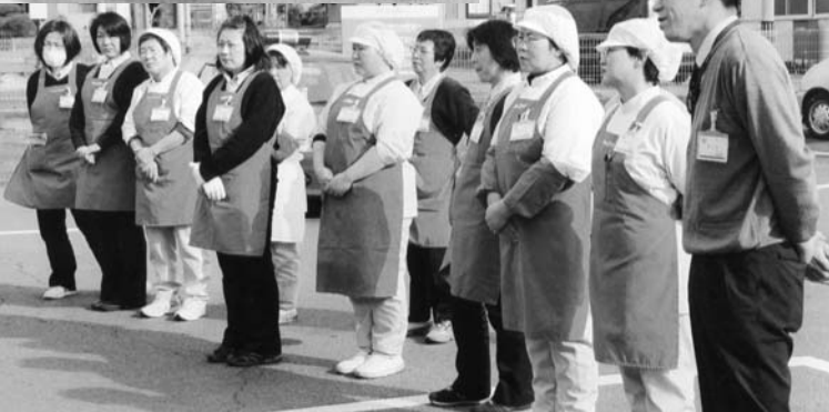
講評を聞く従業員

福島県天然記念物「戸津辺の桜」が開花します。樹齢600年のエドヒガン桜が優雅に咲きます。ぜひお出かけください。