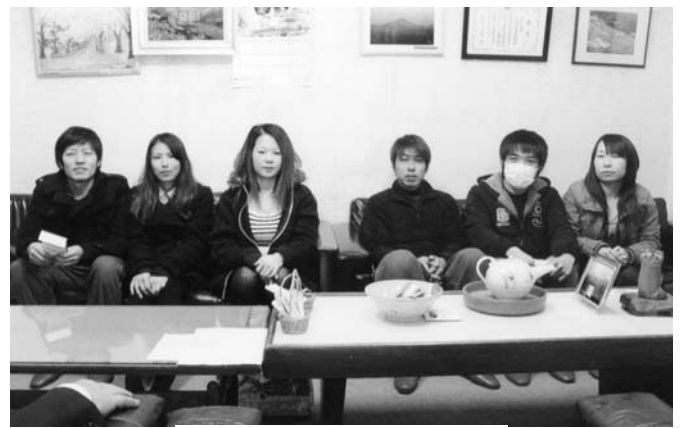
出席した幸せご夫妻

3月15日、今年度4回目となる結 婚祝い金贈呈式が町長室で行われ、 5組のカップルに結婚祝い金を贈 りました。式は、町長が一組ごと に祝い金を贈呈し、「結婚おめでと うございます。新家庭を持たれた 夫婦仲良く、たくさんの赤ちゃん を産んで、健康で明るい家庭を 築いて下さい」と挨拶を述べ、そ れぞれのご夫妻を祝福しました。