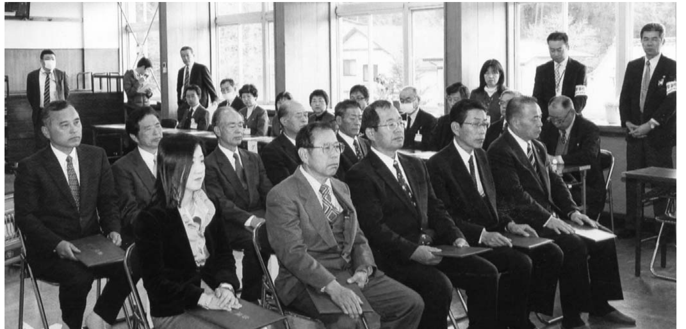
当選の重みを実感