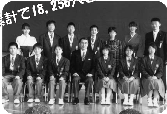
第58回関岡小卒業式