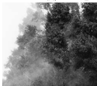
大量に飛散する花粉