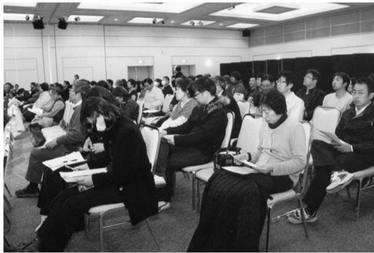
熱心に聴講する参加者