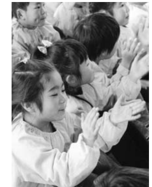
ハッスルする園児たち