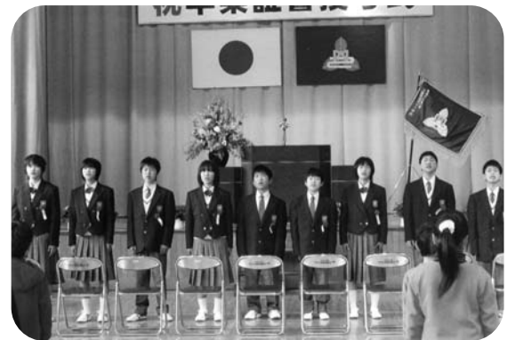
第134回内川小卒業式