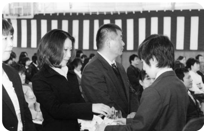
今までありがとう