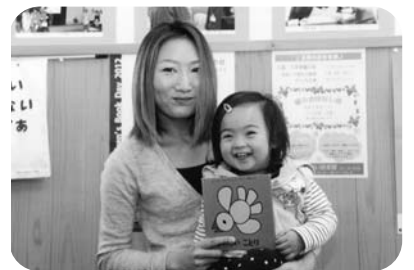
矢祭もったいない図書館利用者