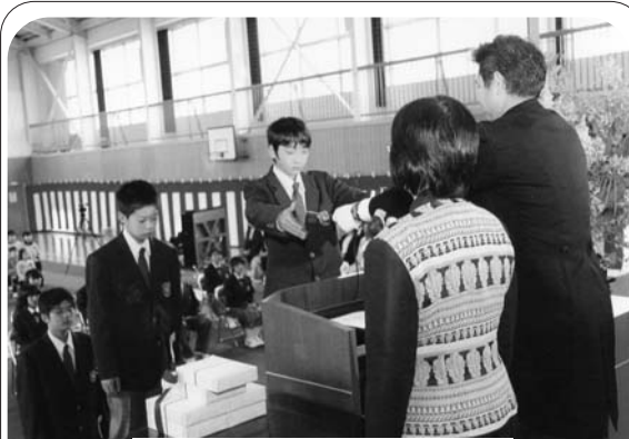
第138回石井小卒業式