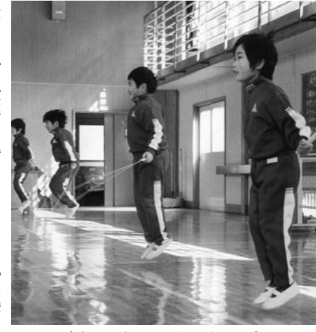
声援を受けてがんばる児童

2月22日、内川小学校(渡邊健順校長)で校内なわとび 記録会が行われ、全校生24名が練習 の成果を披露しました。記録会は7種 目が行われ、まず学年ごとに前跳び 3分間への挑戦が始まりました。