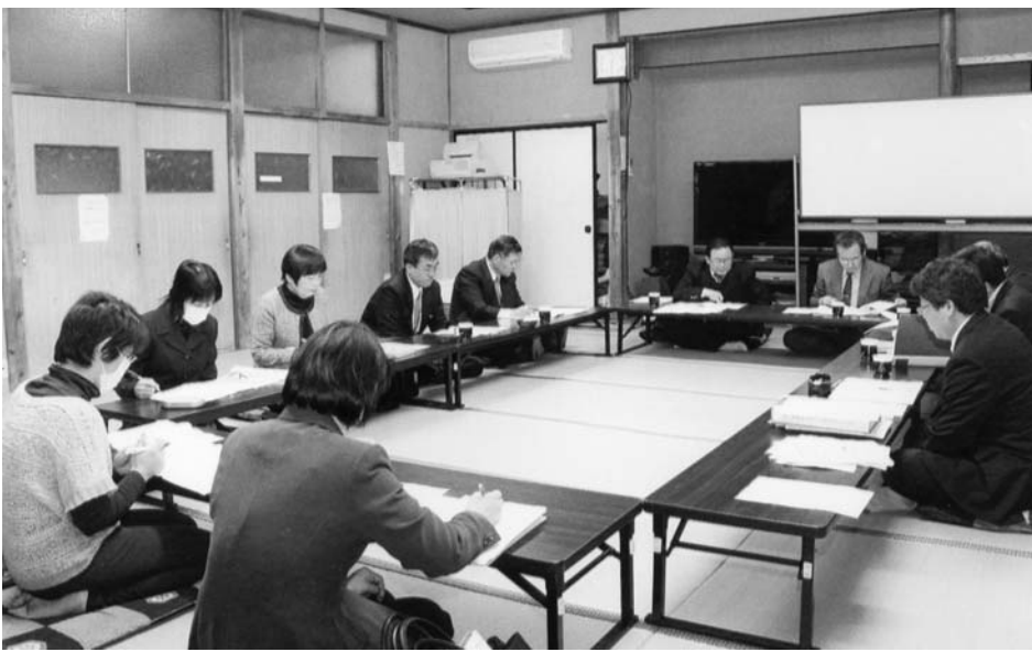
検討委員会のような様子

今回の協議内容は年度末までにまとめられ、教育委員会に中間報告することになります。