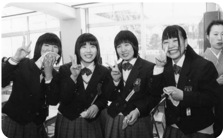
教室で涙顔のVサイン

ちここに。さらに式歌で在校生が「蛍の光」を、卒業生が「仰げば尊し」を合唱すると、涙ながらに歌う生徒の姿が数多く見られました。