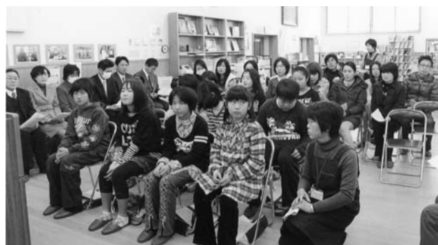
出席した受講生と保護者