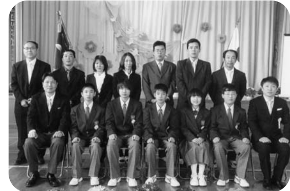
第138回下関河内小卒業式