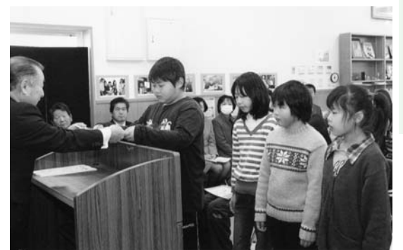
子ども司書認定証交付