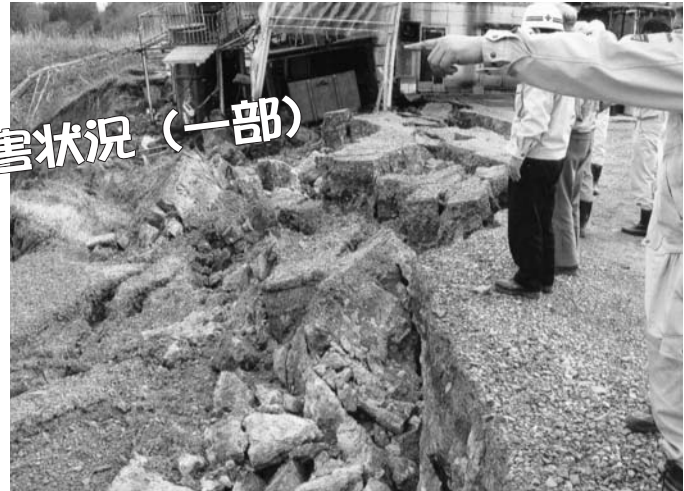
昨年の被害状況(一部)