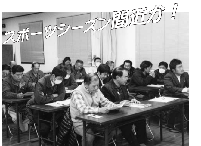
出席した団体代表者