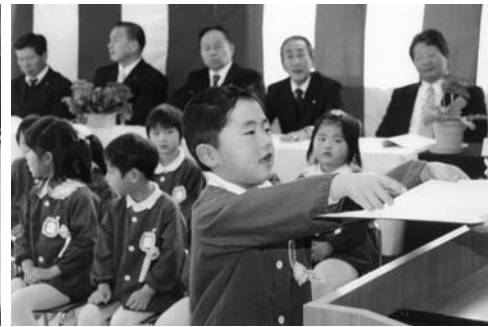
修了証書授与(東館幼稚園)