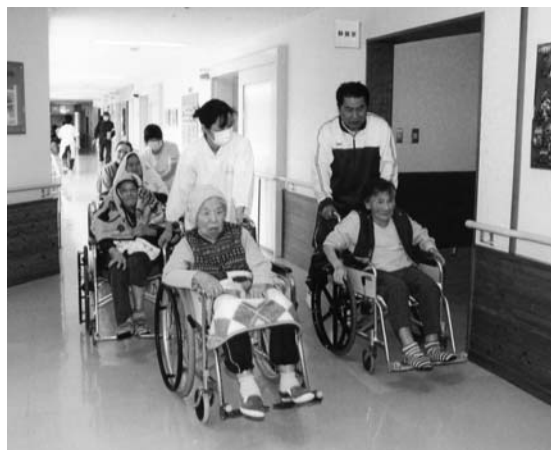
緊張しながらの避難