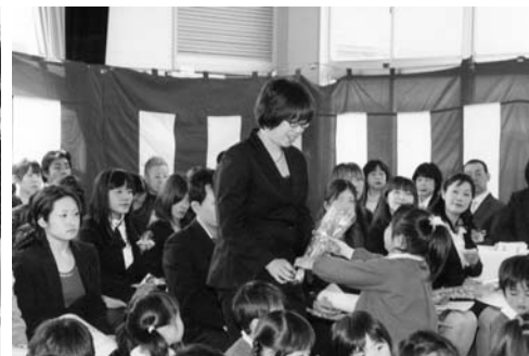
"お母さんありがとう"(東館幼稚園)

告、会計監査報告が行われ、いずれも承認され、新年度の事業計画案、収支予算案についての提案があり、審議の結果、いずれも原案どおり決定いたしました。