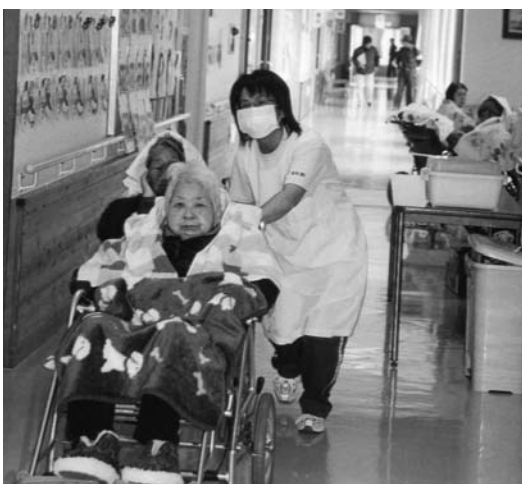
一人で車椅子2台誘導

※白河管内の火災原因の第1位は「焚き火」です。家庭ごみの焼却は、絶対にやらないでください。