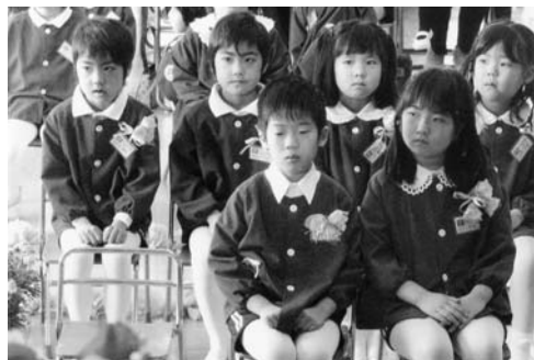
大きく成長した園児(石井幼稚園)