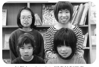
矢祭もったいない図書館利用者

わが家のイチおしは、きいろいことりが牧場遊びに来て、沢山の動物や人に出会うという絵本です。子どもが生まれる前から読み聞かせていたので、タイトルを言うだけで大喜びです。 文は短く、絵も大きく描かれていますので、0歳からの幼児でも見ただけで楽しめます。沢山の動物が登場するので、文とは別に動物の泣き声を真似て読んであげると、とても喜びます。絵も分かりやすく、読み方や見せ方に工夫ができ、親子で楽しめるイチおしの本です。