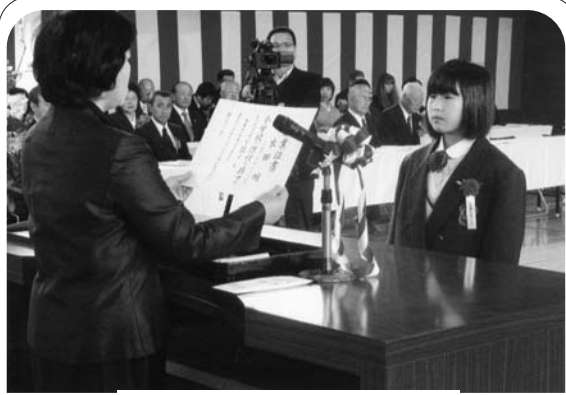
第139回東館小卒業式