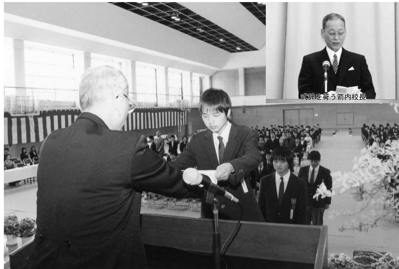
式辞を行う箭内校長