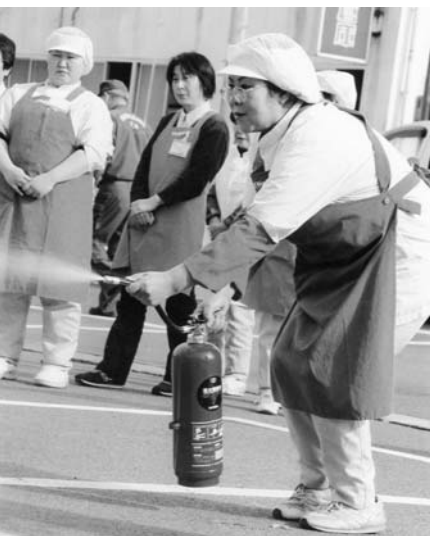
消火器取扱い訓練