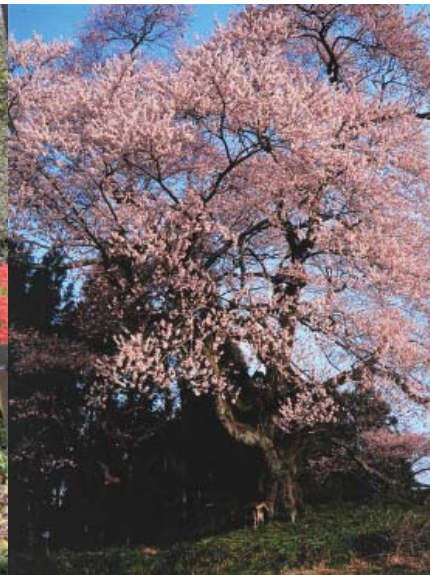
(上) 満開に咲き誇る樹齢約 600 年の戸津辺の桜 (左下) 戸津辺の桜と水郡線 (中下) 9 月上旬が見頃となるマンジュシャゲ (右下) 整備前の戸津辺の桜