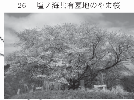
26 塩ノ海共有墓地のやま桜