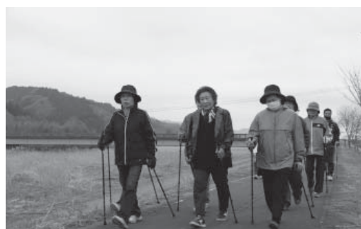
気軽に楽しめるノルディックウォーキング

3月24日、サイクリングロードにおいて、町スポーツ推進員の指導のもと、ノルディックウォーキング教室を開催しました。ノルディックウォーキングは、2本のポール(ストック)を使って歩行運動を補助し、運動効果をより増強するフィットネスエクササイズ的一种です。ノルディックウォーキングの最大利点は、なんといっても年齢性別を問わず気軽に楽しめ、エクササイズの効率が非常に良いことでもあります。一般的な歩行運動と異なり、上半身の筋肉もより積極的に使われて、首や肩の血行も促進され鍛えることができます。