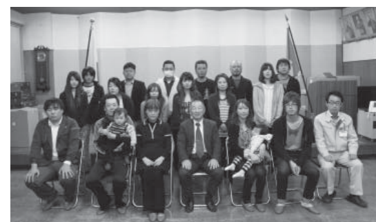
出席した幸せご夫妻

3月25日、結婚祝い金贈呈式が役場第一会議室で行われ、11組のカップルに結婚祝い金を贈りました。式は、町長から一組ごとに祝い金を贈呈し、「矢祭町は子育てするのに大変良い環境です。1人でも多くの赤ちゃんを産んでください」と挨拶を述べ、それぞれのご夫妻を祝福しました。結婚祝い金は、平成22年度より開始され、婚姻時に10万円、婚姻後3年目に10万円が贈られ、現在まで63組のカップルに贈呈しています。