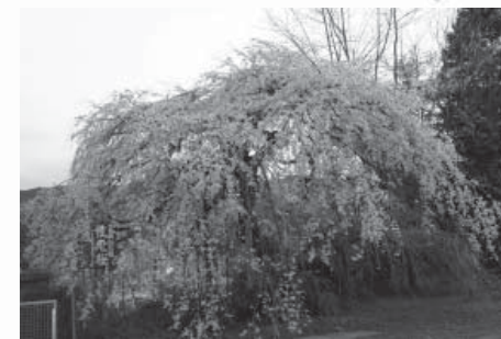
18 下関河内小学校のしだれ桜