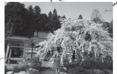
9 光源寺のしだれ桜