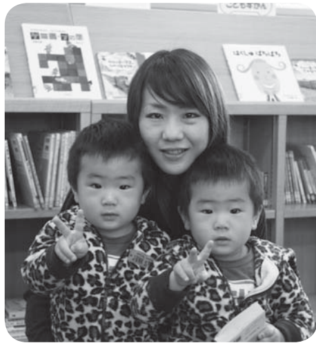
矢祭もったいない図書館利用者