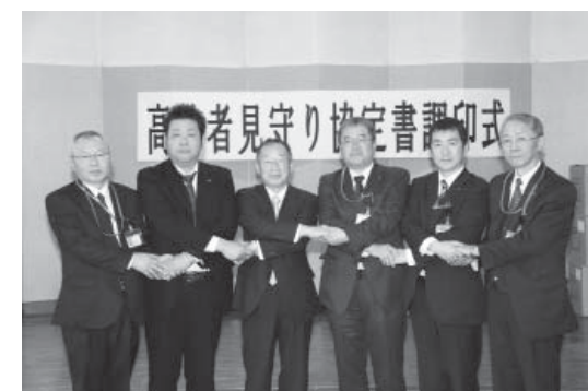
古張町長と握手を交わし記念撮影

3月13日、役場第一会議室において、矢祭町と(有)矢祭新聞販売センター、日本郵便(株)の矢祭・高城・石川郵便局との高齢者見守り協定書調印式が行われました。