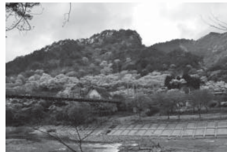
23 矢祭山県立自然公園の桜群