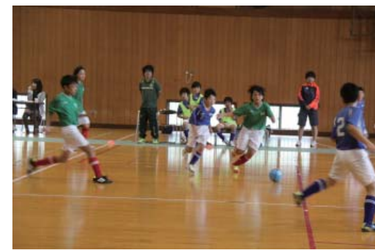
熱戦が繰り広げられた会場

9月7日、第60回やまつりCUP少年スポーツフェスティバルが町体育センターで行われました。雨のため、サッカーをフットサルに変更し開催。選手たちのプレーに会場からは大きな声援が送られていました。なお、結果は次のとおりです。▶I部①東館スポ少②石井スポ少③関岡スポ少▶II部①東館スポ少A②石井スポ少③東館スポ少B