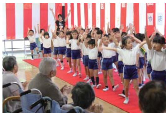
楽しく会場を盛り上げた園児たち

9月12日、社会福祉法人矢祭福祉会の特別養護老人ホーム「ユールアイホーム」で敬老会が行われ、やまつりこども園の幼児教育部の子どもたちが訪問し歌や踊りを発表しました。また、園児が入所する高齢者1人1人に肩たたきをしたり手作りのプレゼントを渡すなど交流し、楽しいひとときを過ごしました。