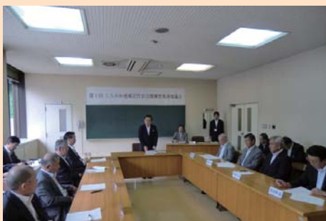
活発な意見交換が行われた会議

今後は定期的に会議を開催しこれまでの連携や協力体制を尊重しつつ各市町村が持つ都市機能や地域資源を有効に活用した、将来にわたり安心して暮らせる魅力ある地域を作っていくために必要な事業について協議・検討を行います。