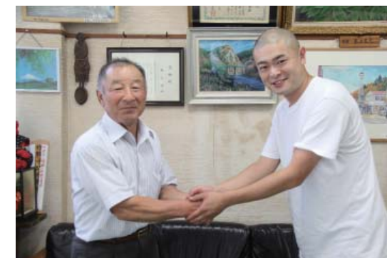
忙しい中撮影のために来町してくれたあばれる君

9月17日、役場に矢祭町が生んだ人気急上昇中のタレント「あばれる君」が来庁し、町長と挨拶を交わしました。今回あばれる君が来町したのは、町が商工会青年部に制作を依頼しているKFB・東邦銀行ふるさとCMコンテスト2014のCM作品に出演協力するためです。なおCM大賞の審査会は11月23日に郡山女子大学で行われます。