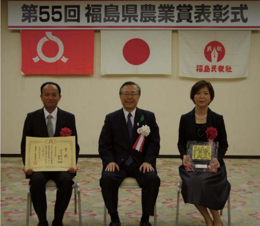
夫婦、そして大切な矢祭鉢物研究会の仲間たちとつんだ功績。2人の顔から今までの苦労、努力がにじみ出ています。