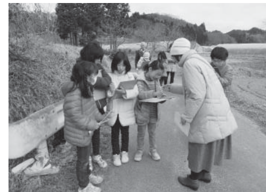
季語探しをするスクール生たち

2月1日、町教育委員会主催、町文化団体連絡協議会が協賛するジュニア俳句スクールin矢祭が行われました。