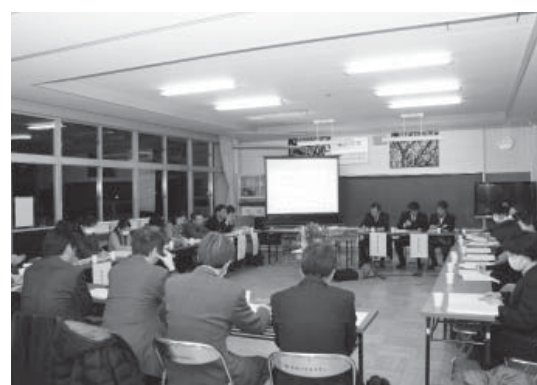
子どもの健康についての協議が行われた委員会

2月25日、県南保健福祉事務所や学校医、学校歯科医、各学校の校長、養護教諭、町関係者などが参加し地域学校保健委員会が東館小学校で行われました。初めに各養護教諭よりむし歯、肥満、受動喫煙についてのこれまでの対策における成果と課題、今後の方向性について説明がありました。県南保健福祉事務所や学校医、学校歯科医から、それぞれの点についての指導がされ、矢祭町の子どもたちの健康課題に対する充実した協議が行われました。