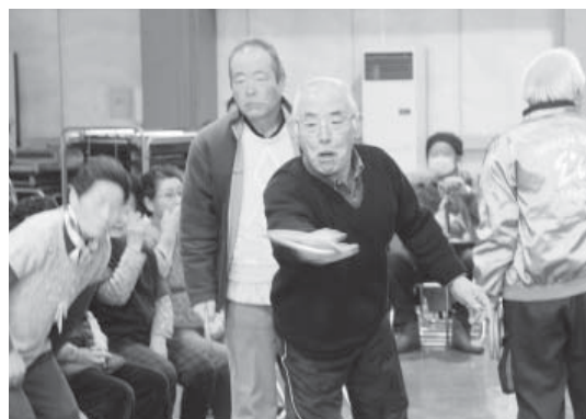
狙いをすまして輪を投げる選手

2月14日、高齢者クラブ会員の健康増進の充実を図ることを目的に町高齢者クラブ連合会主催の第13回クロリティー大会が山村開発センターで行われ、熱戦が繰り広げられました。