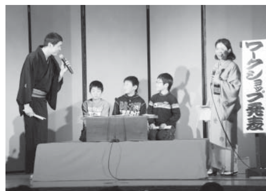
講談の体験をする小学生

2月24日、関岡小学校で「次代を担う子どもの文化芸術体験事業」として講談が行われました。講談発表で子どもたちは3人1組でステージに上がり、水戸黄門の講談を発表し、「緊張したけど楽しかった」、「感情を込めて発表することができた」などと感想を述べました。