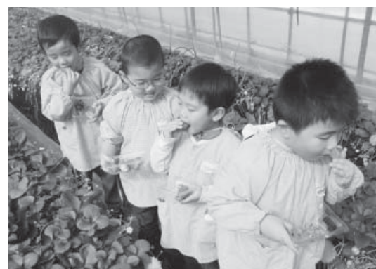
いちご狩りを楽しむ園児たち

園児たちはハウス内に長い列をなし、口の周りをいちごで赤くしながら大きないちごをほおぼっていました。このいちご狩りは、そらの社の無料提供のもと今年で14回目を迎える恒例行事となっています。