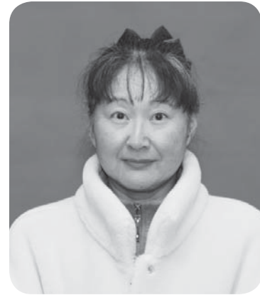
矢祭もったいない図書館利用者