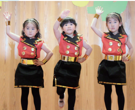
ダンシングヒーロでダンス