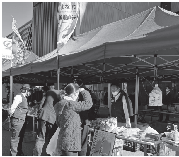
郡内の新鮮野菜などを販売し約1000人が訪れました