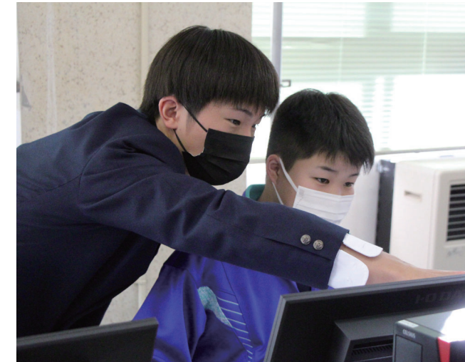
プログラミングして3Dプリンターでボルトを製作