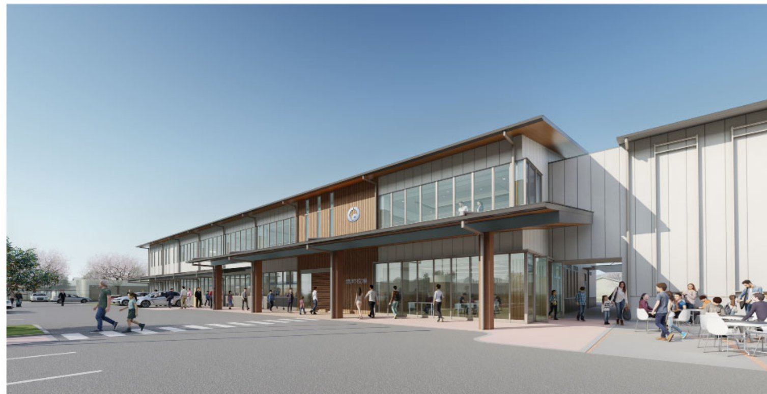
令和6年5月に開庁予定の役場新庁舎