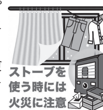
ストーブを使う時には火災に注意