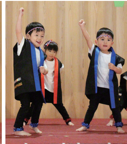
ソーラン節に合わせて