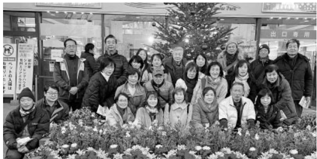
500万球以上のイルミネーションを楽しみました

12月3日(土) 日本三大イルミネーションの一つである栃木県足利市のあしががフラワーパークに会員28人が参加しウォーキングしました。イルミネーションの幻想的な雰囲気に包まれながら、寒さを忘れウォーキングを楽しみました。