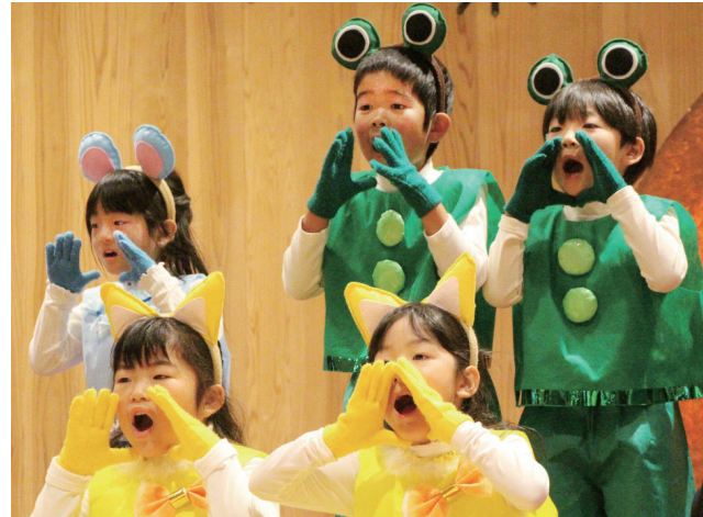
動物になりきって演じました