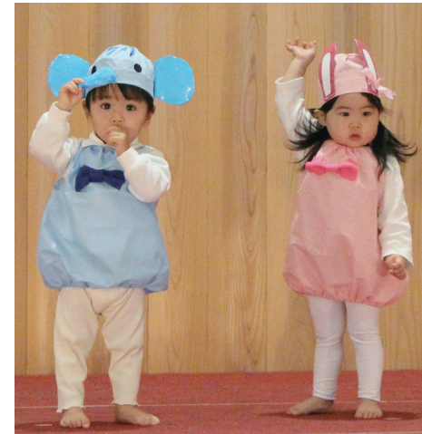
はい、主役は私たちです