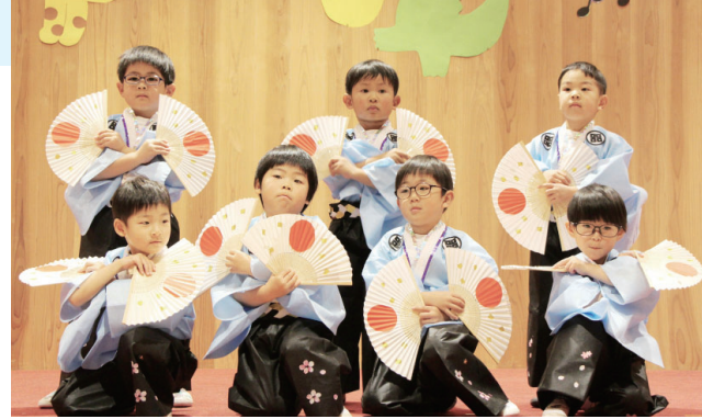
サブちゃんの「祭り」