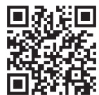
産業サポート白河ホームページQRコード