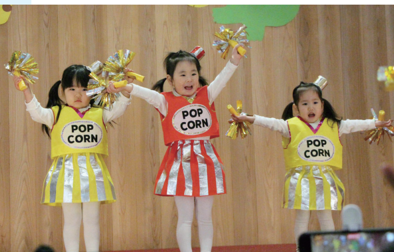
弾けるポップコーン

11月26日(土) はなわこども園幼稚部で生活発表会が、12月10日(土) に保育部でおゆうぎ会が行われました。園児らは保護者や先生が準備した衣装に身を包み、歌や踊り、劇に大活躍で、この日のために練習してきた成果を十分に発揮しました。会場につめかけた保護者からは、「感動した」や「泣けてきた」、「最後までちゃんとできて良かった」などの感想がありました。