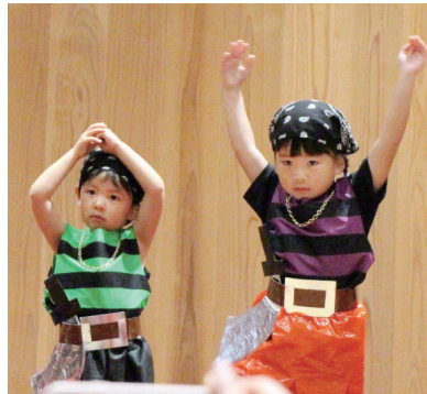
ひよっこりひょうたん島