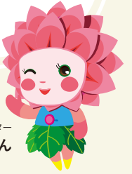
埜町観光キャラクター ダリちゃん

埜町はいつでも花盛り!!久慈川河川敷が満開の桜でいっぱいになる春。風呂山公園が山つつじで真っ赤に染まるゴールデンウィーク。町の至る所でダリアが咲き誇る夏から秋。那倉川溪谷の紅葉が美しく色づく秋。ぜひサイクリングとともに、お花も楽しんでね。