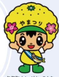
矢祭町イメージキャラクター やまっぴー

里山、田んぼ、清流…思い浮かべる田舎の風景を体感できるコースです。四季折々の景色、匂い、暮らしを感じながらの散歩と行く先々での美味しい食事は、おなかも心も満たしてくれます。ちなみにやまっぴーは鮎の塩焼きが大好きです。食べてみてね！