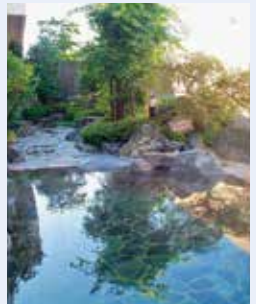
ゆーばるやまっぴー