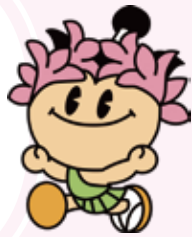
棚倉町シンボルキャラクター たなちゃん

豊かな自然の新鮮な空気と、城下町の歴史を感じることができるコースです。桜や紅葉の頃は棚倉城跡のお堀の水面に映る景色や、山本不動尊のもみじ参道がきれいだよ。二つの一宮、神社仏閣のパワースポット、おいしいお菓子やパン屋さんも沢山あるよ。東北の小京都棚倉で、幸福・満腹めぐりに出かけてみよう!