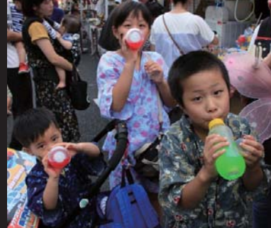
哺乳瓶型のジュースも人気