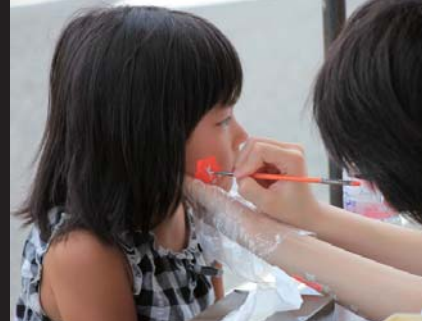
毎年人気のフェイスペイント