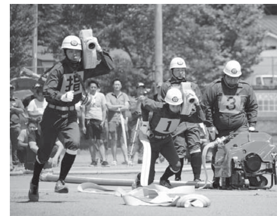
「操作始め！」指揮者の合図で一斉に選手らが動き始めます(小型ポンプ)