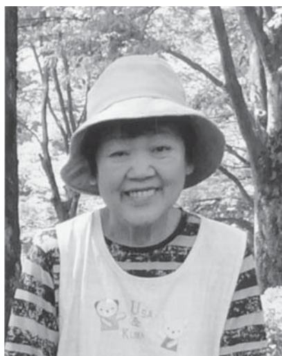
このコーナーでは、東京埼会の皆さんの住む街のことや近況について紹介しています。