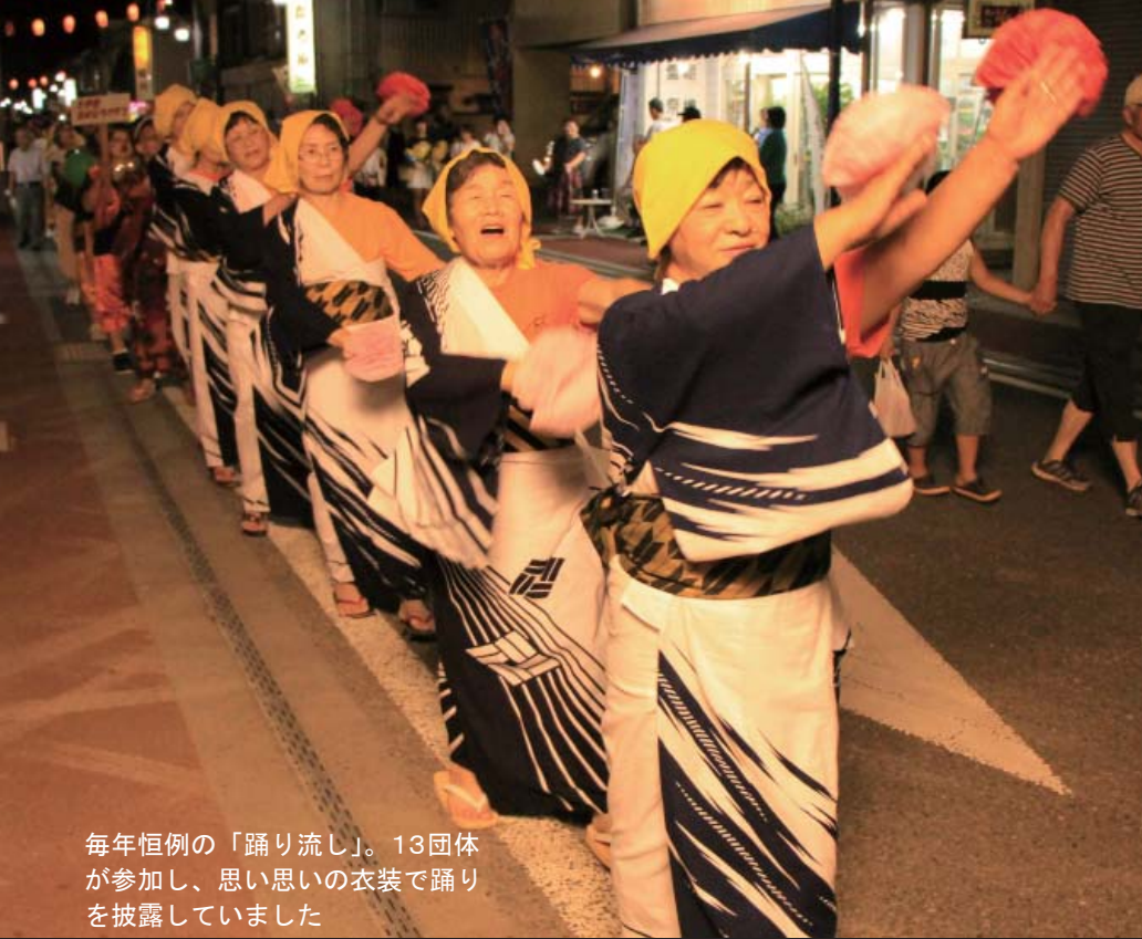
毎年恒例の「踊り流し」。13団体が参加し、思い思いの衣装で踊りを披露していました