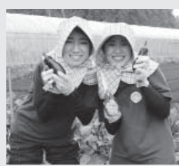
新鮮な野菜を収穫できました

7月、8月の猛暑は、酷暑の時間帯を避けての作業でも、「うーん」とうなってしまふような暑さでした。花も人も我慢の季節の台宿圃場に、暑さもふきとばすフレッシュな女子学生20人が8月6(月)から8日(水)の2泊3日で農業体験の研修のため、台宿の圃場に来てくれました。