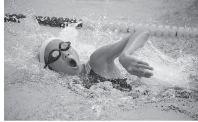
参加者は練習の成果を発揮することができました