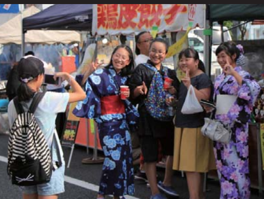
「ハイ！チーズ！」。商店街にはたくさんの笑顔が溢れました