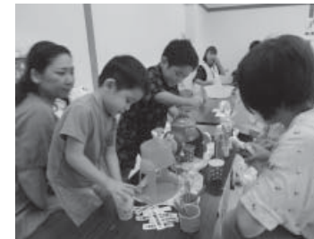
かき氷屋さん、頑張ってる！