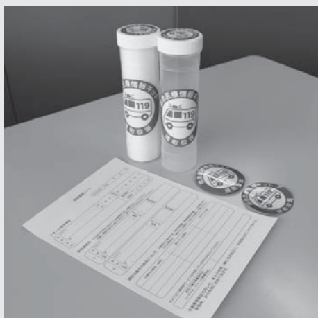
▲65歳以上の一人暮らしの方へ配布している救急医療情報キット

町では、65歳以上の一人暮らしの方を対象に、地区の民生委員さんや高齢者見守り隊の方を通して、救急医療情報キットを配布しています。救急医療情報キットとは、緊急時の連絡先や病名、かかりつけ医などの情報を記入した用紙を筒の中に入れ、自宅の冷蔵庫に保管し、救急や災害に備えるものです。配布されたら忘れずに記入し、保管してください。