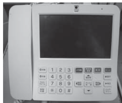
今年度から口座振替が可能になったIP告知システム使用料