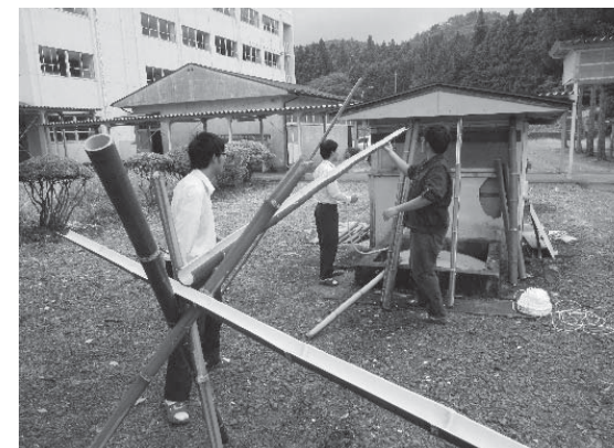
復活した井戸で流しそうめんを楽しむ生徒ら

埴工業高校の中庭には井戸がありますが、くみ上げポンプが故障したまま、数十年間使われていませんでした。しかし、先人が残してくれた資源を無駄にしないために、井戸の復活を試みました。電源工事は、電気工事士の資格を生かして、生徒たちで協力して行いました。作業後に蛇口を開くと、冷たい井戸水が溢れ出しました。早速、竹で戸井を作り、流しそうめんを楽しみました。猛暑が続いた今年の夏は、特に「命の水」になりました。