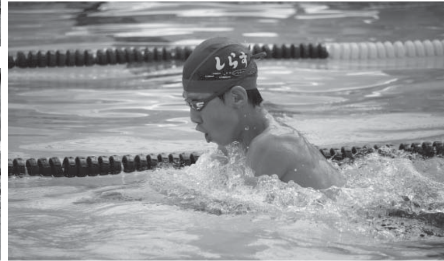
ダイナミックなフォームでゴールを目指します