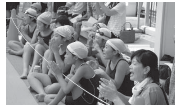
「頑張れー！」応援にも力が入ります