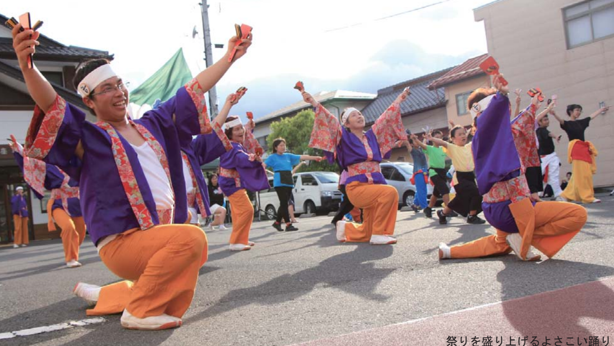
祭りを盛り上げるよさこい踊り