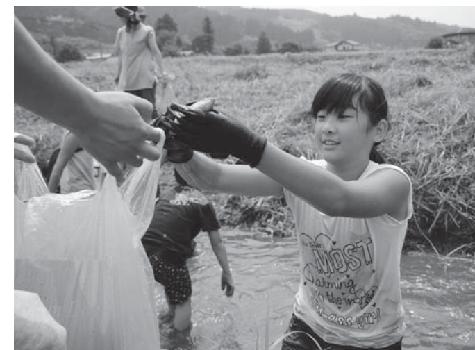
子どもたちは上手にヤマメを捕まえていました