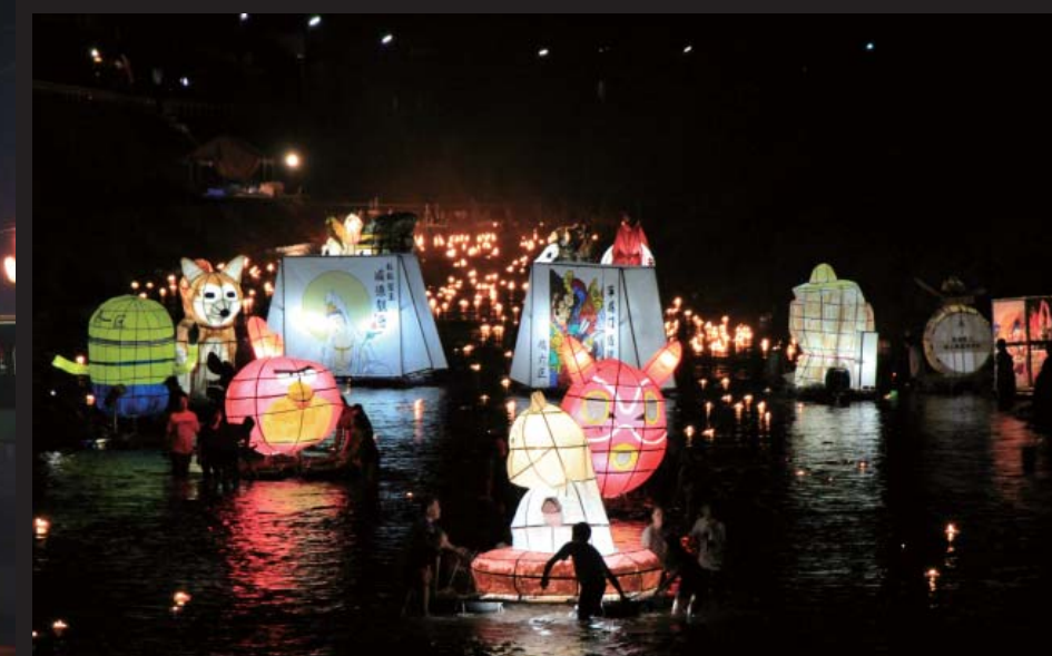
川上川には大小さまざまな灯籠が流れ幻想的な雰囲気を生み出しました