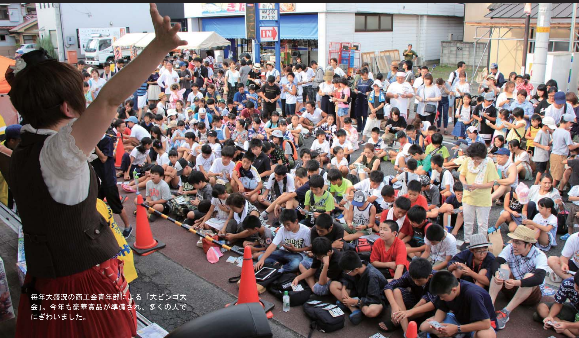
毎年大盛況の商工会青年部による「大ビンゴ大会」。今年も豪華賞品が準備され、多くの人でにぎわいました。