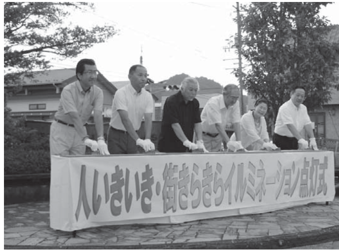
関係者の手で一斉に光が灯されました