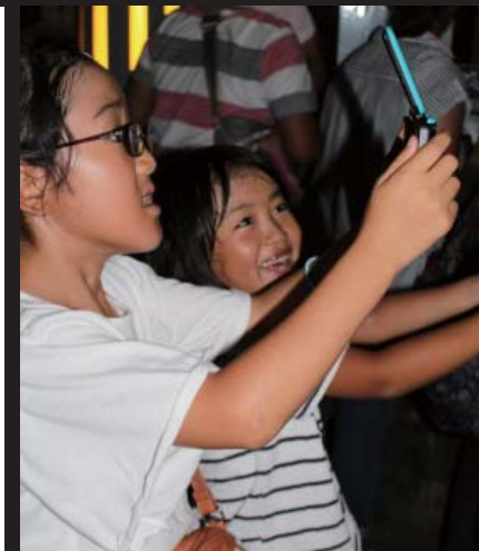
花火は上手に撮れたかな

インターネットで流灯花火大会を知って、今年初めて来ました。活気があってとてもいいですし、親子で楽しめます。来年も、ますますこのお祭りが盛り上がることを期待しています。