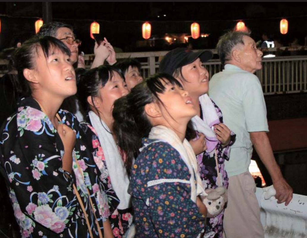
多くの人が夜空に咲く大輪の花火を見て夏の一夜を楽しみました