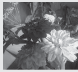
きれいな花束ができました

1日目はメロン組合さんが手塩にかけて育てた野菜の収穫体験。学生さんたちは「都会ではなかなか土とふれあうことがないので、貴重な体験です!」と話してくれました。2日目はダリアの手入れ体験、3日目は花束づくり体験です。花束づくりでは「たくさん形のや色があるダリアはどれも素敵で、人によって合わせ方が違い、それぞれの個性が出るところがとても面白いと感じました。埴町に来て、お花が大好きになりました!」といううれしい感想が聞かれました。人の個性を引き出す花、魅力あふれるダリアを、ますますきれいになっていく秋に向けて、大切に育てていきたいと思っています。(記・川村)