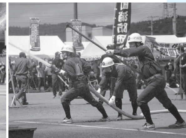
規律厳正な操法には観客から大きな拍手が送られました(ポンプ車)