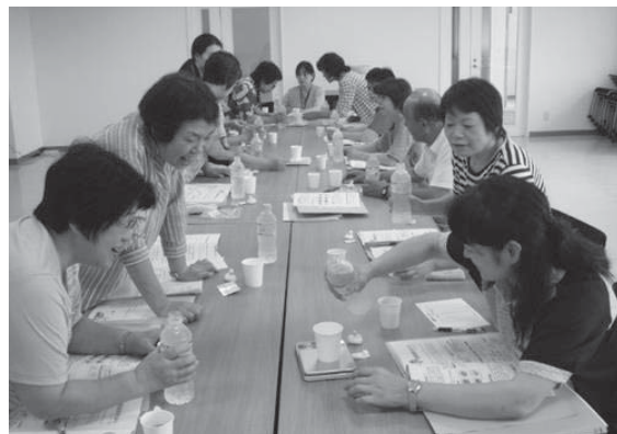
熱中症予防のスポーツドリンクづくり(8月3日(金)笹原方部)

【自分の体の状態を知る】 活動1年目となる今年、「自分の健康」に関心を持つことから始めます。研修会では、自分の健診結果から数値の変化に注目し、体の状態を見ていきました。そのためには、毎年健診を受け、体の変化を経年的に見ることが大切だと知ることができました。