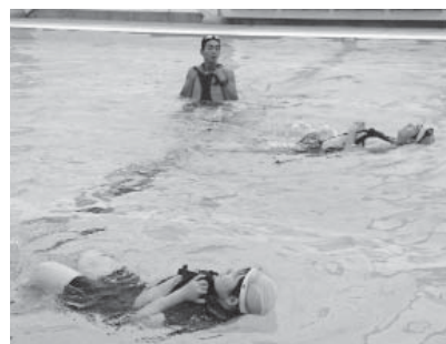
いざという時に命を救う浮き身