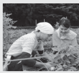
ダリアの手入れ体験

7月、8月の猛暑は、酷暑の時間帯を避けての作業でも、「うーん」とうなってしまふような暑さでした。花も人も我慢の季節の台宿圃場に、暑さもふきとばすフレッシュな女子学生20人が8月6(月)から8日(水)の2泊3日で農業体験の研修のため、台宿の圃場に来てくれました。