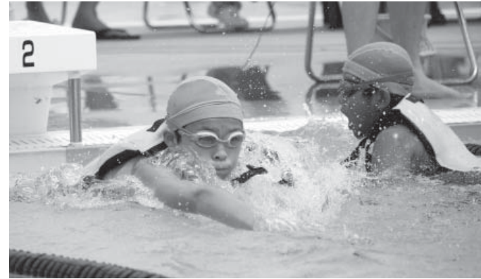
次の泳者にタッチ（ライフジャケットリレー）