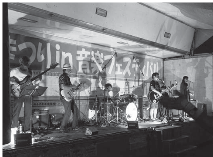
さまざまな音楽が会場を盛り上げました

7月28日(土) はなわ代官にぎわい座主催の「第13回代官七夕まつりin音楽フェスタ」が、埴代官所跡周辺で開催され、大勢の人でにぎわいました。昨年に引き続き開催された音楽フェスタでは、安全帯ロックバンド(東京都)をはじめ、コーラスユニットのカラーズ(白河市)やアロハはなわ(埴町)などが出演。売店では夏の味覚が販売され、来場者は音楽を聞きながら、楽しい夏のひとときを過ごしました。