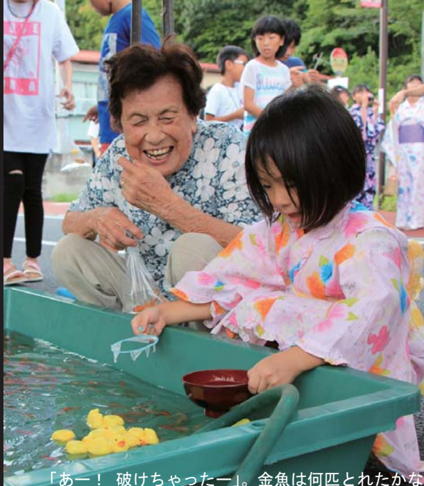
「あー！ 破けちゃったー」。金魚は何匹とれたかな