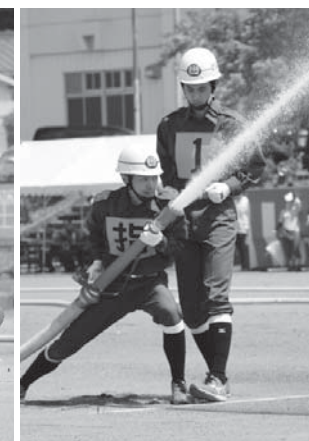
「筒先員交代！」息もピッタリです(小型ポンプ)