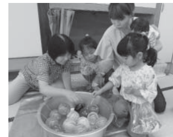
何色のヨーヨーがつれるかな？

費用：無料 持ち物：おやつ・飲み物 申込先：埴町公民館 ☎43-0320 申込期限：9月13日(木) ※バスの定員がありますので、事前の申し込みをお願いします。