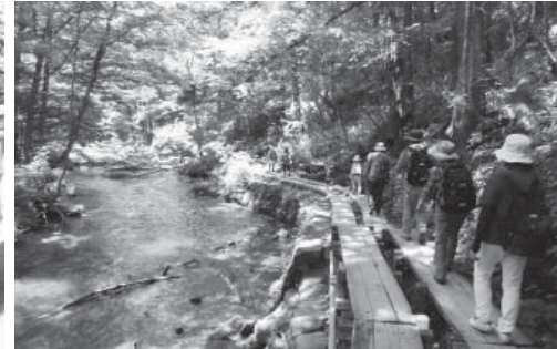
涼しい川風に誘われ、木道を進みます

晴天の戦場ヶ原を軽快に♪ 町民ハイキング大成功! 7月9日(日)、公民館主催の町民ハイキングを行いました。晴天の下、小学生を含む参加者63名は、湯滝や湯ノ湖を眺める日光戦場ヶ原の全長約7kmの木道コースを、思い思いのペースで軽快に歩きました。