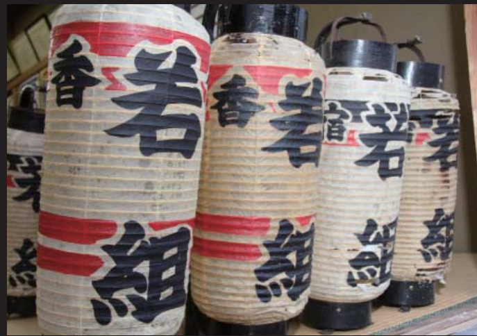
歴史と伝統を感じます