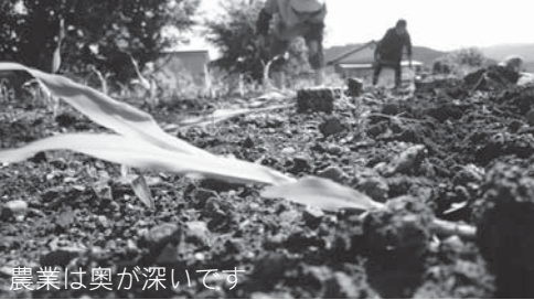
農業は奥が深いです