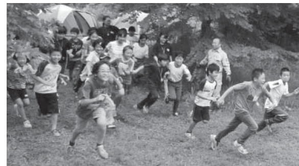
夕飯の食材を求め、全速力で駆け回ります

自然体験キャンプ 一雨にも負けず頑張りました! 7月25日(火)・26日(水)の2日間、片貝地内の小野田記念財団キャンプ場で「埼町自然体験キャンプ」を開催しました。参加したのは、町内の小学生23名、中学生5名と高校生ボランティア7名です。時折激しい雨にも見舞われる中、班の仲間と協力し、テント設置やサバイバルゲーム(食材を見つめる宝探し)、食材を組み合わせての夕食作り、照明なしで山林を歩くナイトハイク、源流ハイクなど、予定された全プログラムに楽しく真剣に取り組んだ子ども達も、この2日間ですごく成長し、夏休みの貴重な思い出を作ることができました。