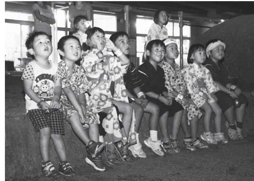
打ち上げ花火に歓声があがります