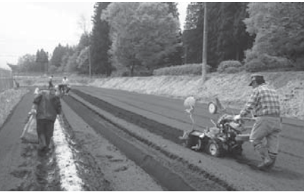
竹パウダー散布中