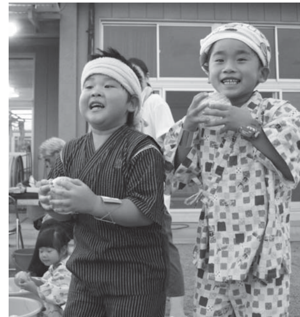
ゲームをたくさん楽しんだよ