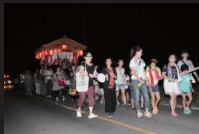
山車が祭りを盛り上げます