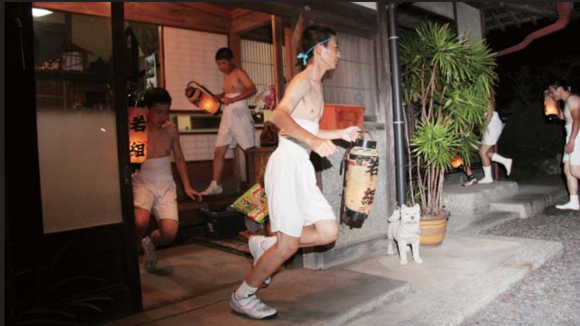
土足のまま、約130件の家を駆け抜けます