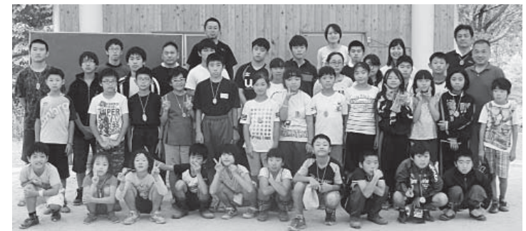
厳しい天候の中、全活動をやり遂げた参加者一同