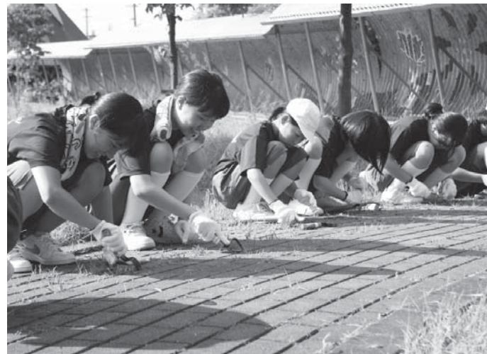
6年目を迎えたラブステーションプロジェクト。とてもきれいになりました。

7月3日(月)・4日(火)・6日(木)・18日(火) 埴町中高連携第6回ラブステーションプロジェクトが、駅前で行了されました。これは、町の顔である駅周辺をきれいにしようと始まったプロジェクトで、今年で6年目を迎えました。今年も、午後4時から埴中学校、埴工業高校の生徒たちが棚倉警察署と連携し、駅前の清掃や草むしり、ゴミ拾いなどを行いました。今年も夏休みを利用して、埴中学校美術部の生徒たちがインターロッキングに絵を描きます。皆さん、お楽しみに。