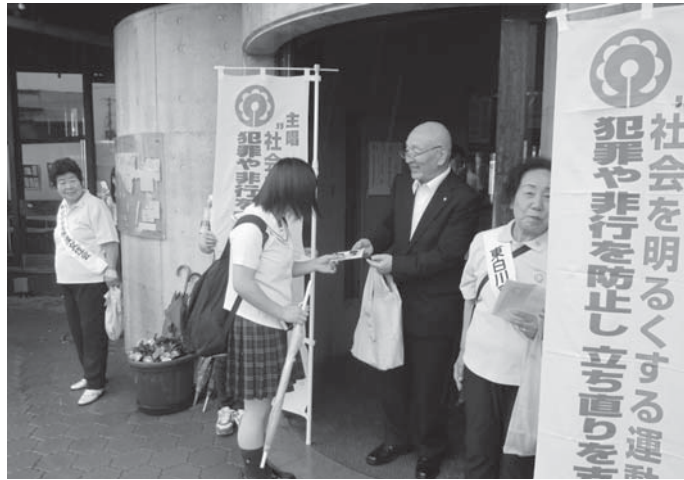
犯罪や非行のない社会を目指しましょう