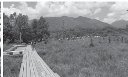
戦場ヶ原の青空に、足取りも軽やか