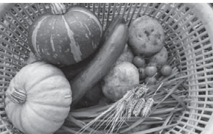
できた野菜はどれも優しい味がしました