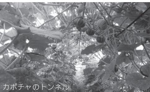
カボチャのトンネル