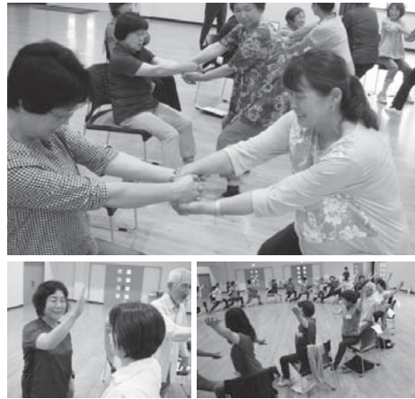
「認トレ」で血流アップ

◆ 全身の血流アップで脳も活発に 「認トレ」では、全身の血流を良くしながら、少し難しい認知課題(たまに間違えてしまう程度)を行うことで、脳が活発になる機会を増やします。「認トレ」の目的は、運動しながら楽しく脳にチャレンジさせることです。上手くできることではありません。上手くできるようになら、皆さんで新しい課題を考えることも「認トレ」になります。