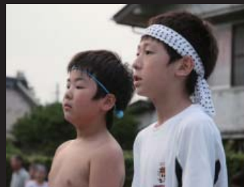
子どもたちも真剣そのもの