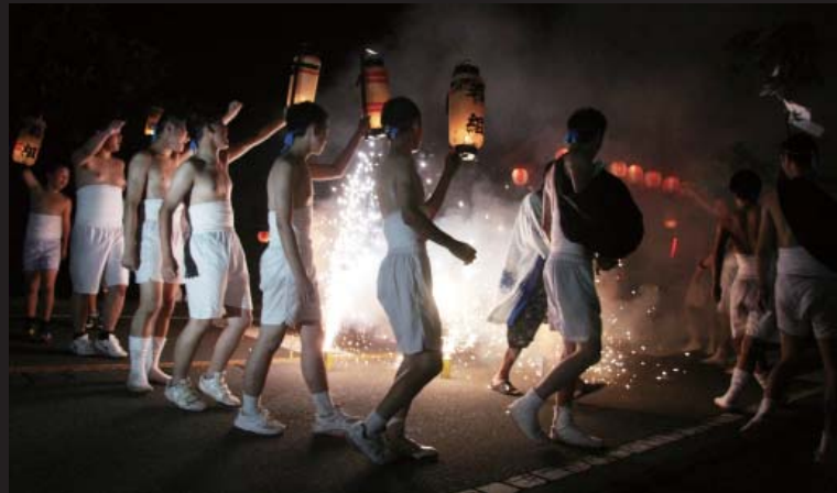
「エイ！エイ！オー！」若組の勇壮な声が地域に響きます