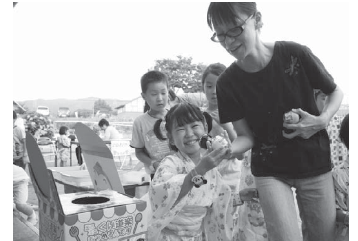
どんな景品が当たったかな