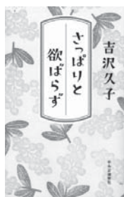
「さっぱりと欲ばらず」