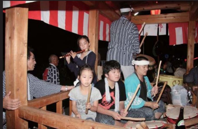
祭りに華を添える太鼓や篠笛