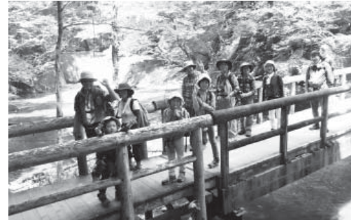
小滝を背に、湯川を渡る参加者