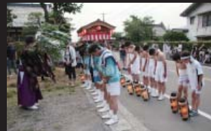
お仮屋で身を清めます