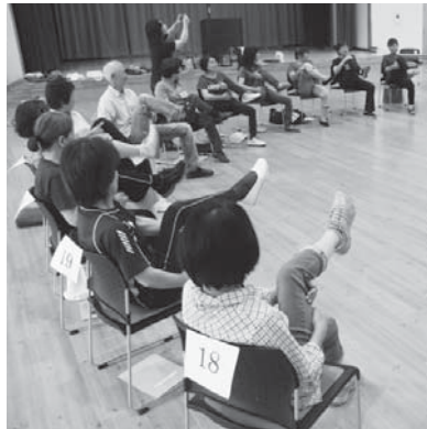
運動を心がけ、健康な体を

年収が約153万円から約211万円の後期高齢者医療被保険者の所得割額は、特例的に5割軽減されていましたが、平成29年度は、2割軽減に改正されました。なお、平成29年度の保険料額決定通知書は8月中旬に発送します。