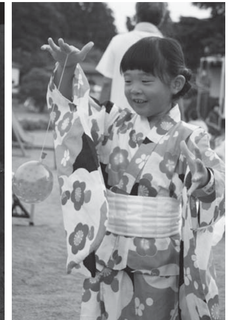
浴衣姿がとてもお似合いです