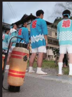
いよいよ出発の時