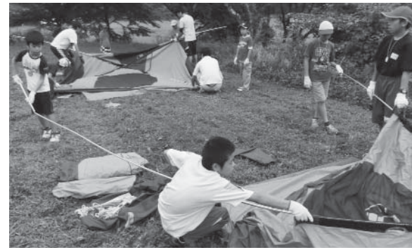
仲間と協力し、テントを組み立てます

自然体験キャンプ 一雨にも負けず頑張りました! 7月25日(火)・26日(水)の2日間、片貝地内の小野田記念財団キャンプ場で「埼町自然体験キャンプ」を開催しました。参加したのは、町内の小学生23名、中学生5名と高校生ボランティア7名です。時折激しい雨にも見舞われる中、班の仲間と協力し、テント設置やサバイバルゲーム(食材を見つめる宝探し)、食材を組み合わせての夕食作り、照明なしで山林を歩くナイトハイク、源流ハイクなど、予定された全プログラムに楽しく真剣に取り組んだ子ども達も、この2日間ですごく成長し、夏休みの貴重な思い出を作ることができました。