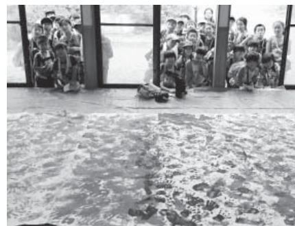
手足と足形で描いた巨大壁画

http://hanawa-fsc.jp 埼町大字埼字桜木町80(埼町営体育館内) ☎0247-57-6589 FAX57-6587 mail:hanawa.fsc@gmail.com