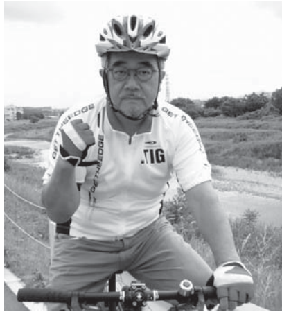
このコーナーでは、東京埼会の皆さんの住む街のことや近況について紹介しています。