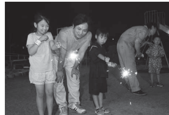
お父さんと一緒に花火を楽しみました