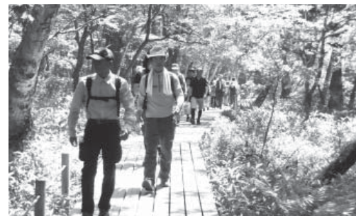
盛夏の緑に、眩しいほどの木漏れ陽