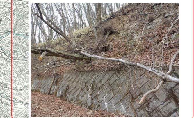
現在状況 (R5. 4月現在)