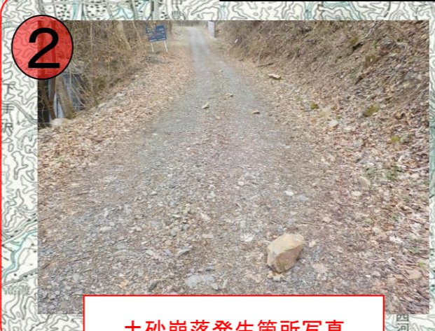
土砂崩落発生箇所写真 (R3落石撤去後)