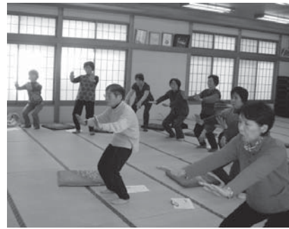
上石井地区の健康教室

◆ 木野反・湯岐、板庭地区 本年度から、木野反・湯岐、板庭地区でも「サロン」がスタートしています。月に1回程度、地区の皆さんと顔を合わせる楽しい時間です。（サロンは、大蔵大畑、東河内、水元地区でも開催しています。）