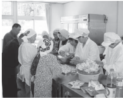
参加者で分担して調理しました

◆ 台宿地区 本年度から、台宿地区で「健康教室」がスタートします。初回は、6月14日（火）に、台宿分館で開催予定です。台宿の保健推進員さんや、回覧、IP放送でもお知らせしていきますので、ぜひご参加ください。（健康教室は、上石井、