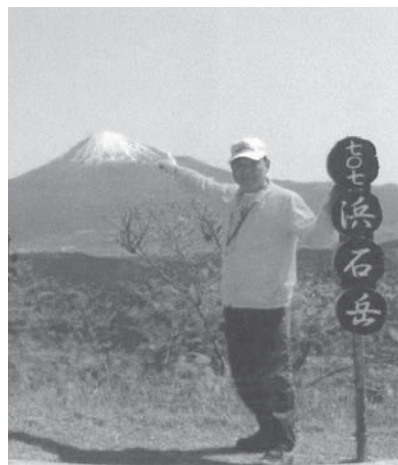
このコーナーでは、東京埼玉の皆さんの住む街のことや近況について紹介しています。