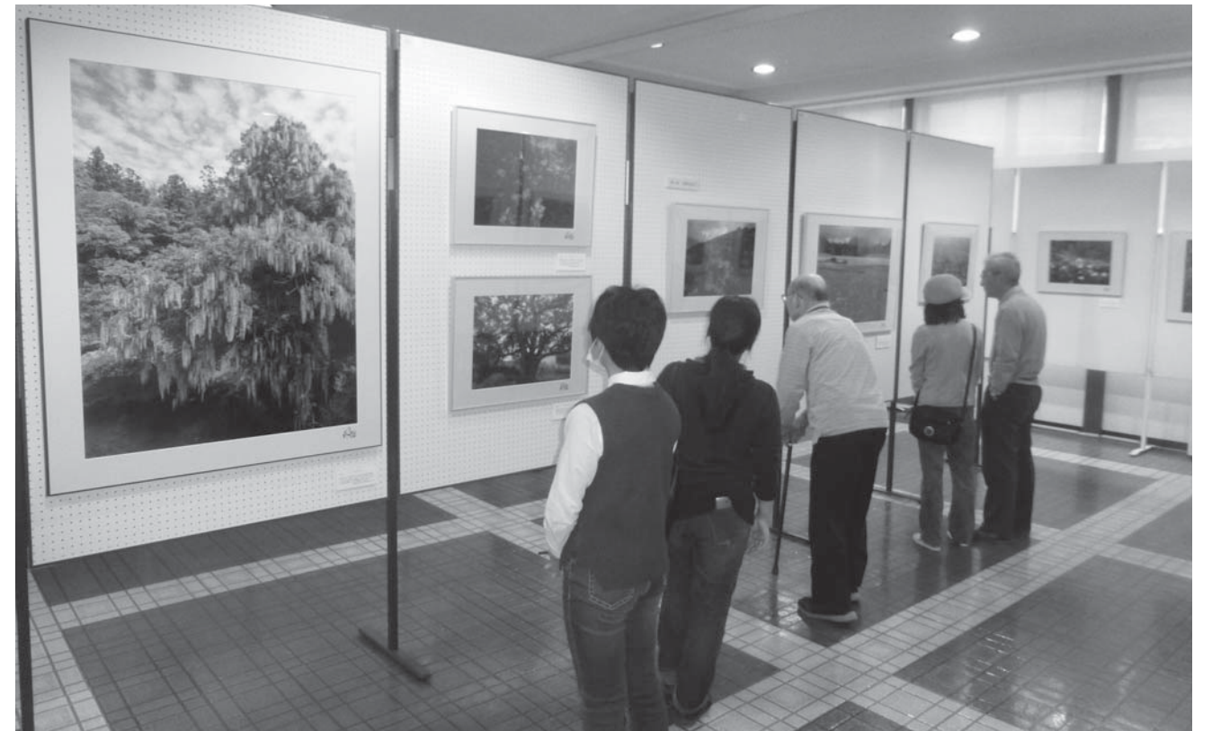
日本の花が持つ美しさに目を奪われます

あなたの地区の話題を提供してください。取材に伺います。 ※広報はなわに掲載された写真を希望される方は、総務課 ☎ 43-2111 までご連絡ください。