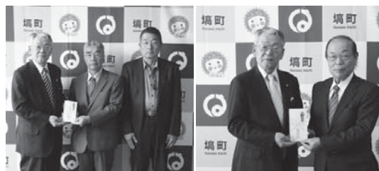
奥久慈埴クラブ 様 太陽測量設計株式会社 様