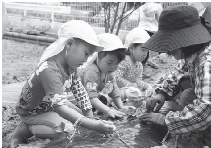
おいしいサツマイモができるように丁寧に植えました