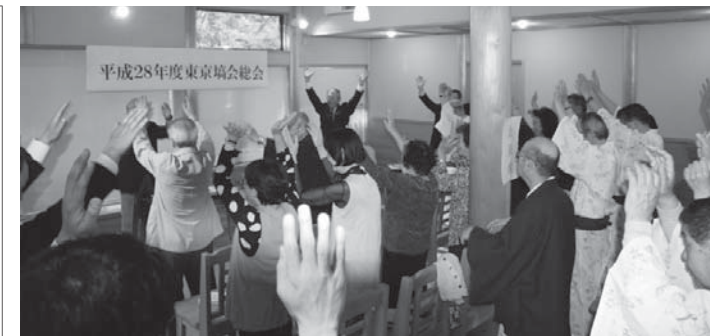
今年も盛大に総会が開催されました