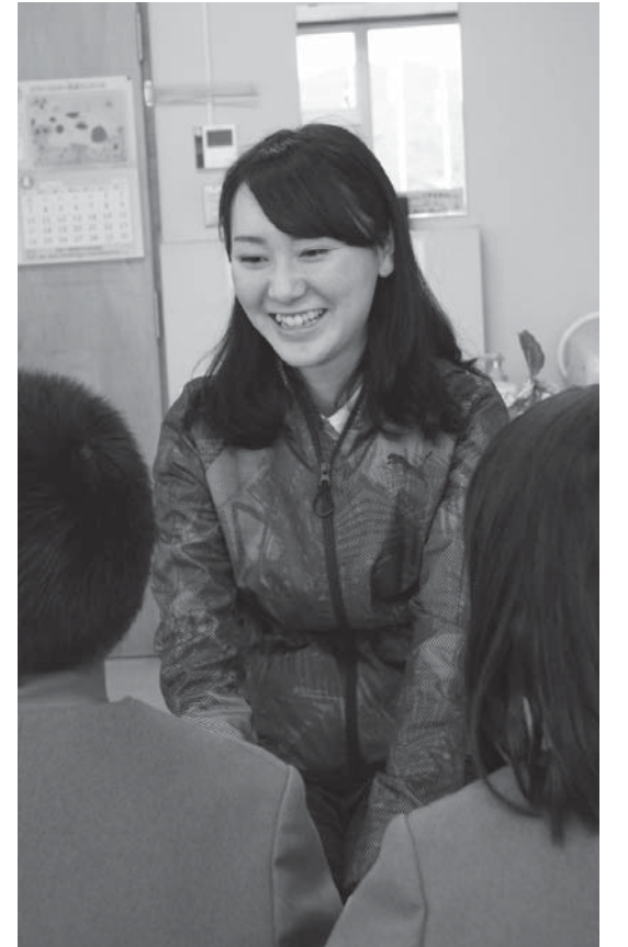
常豊小学校養護教諭

埴倉消防署鮫川分署から赴任してきました。生まれは白河市で、趣味は、山歩きと旅行です。埴分署は、初めての勤務となり、地理に不安がありますが、空気が柔らかく、人情味に溢れる町で、とても安心しました。湯遊ランドのダリア園でダリアを見たり、埴町の山を歩いてみたいですね。今後の目標は、埴町消防団とともに、地域住民の皆さんの安心・安全を守ることはもちろんのこと、今年、消防団によるポンプ操法大会もありますので、選手の皆さんと一緒に、頂点を目指します。