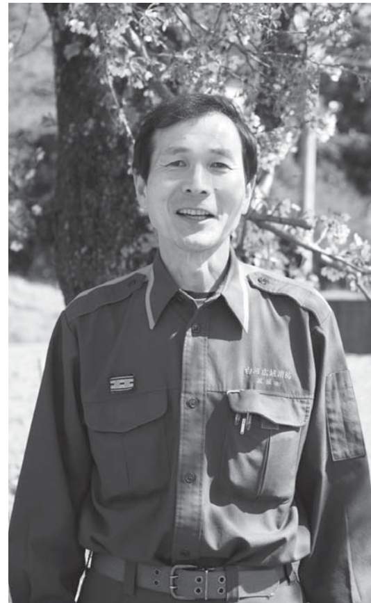
埴倉消防署埴分署長

三春町立中妻小学校から赴任してきました。生まれは福島市で、白河市に住んでいます。趣味はゴルフですが、最近はなかなか行けませんね。平成25年度までは、埴町教育委員会学校教育課で指導主事として仕事をさせていただいておりました。今回、笹原小学校長として埴町に来たとき、皆さまがとても温かく迎えてくださり、人と人とのつながりを大切にする、温かみのある町だと改めて感じました。今後は、皆さんと協力して、地域と共にある学校づくりを目指していきたいと思っています。