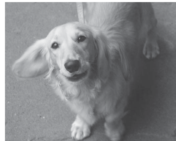
愛犬との楽しい生活のためにもお忘れなく

※各種料金は、釣り銭がないようにお願いします。 ※問診票は必ず記入して持参してください。