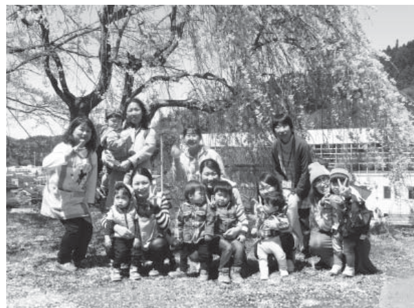
満開の桜を見ながら、楽しいひとときを過ごしました

0才から幼稚園入園前のお子さん と、その保護者を対象にした子育て講座「なかよしルーム」の本年度第1回活動「お花見散歩」が、4月15日(金)、埴町公民館で行われました。 本年度初めての活動となり、参加者同士、仲良く遊んだり話をしたりして、和やかな雰囲気の中で活動することができました。