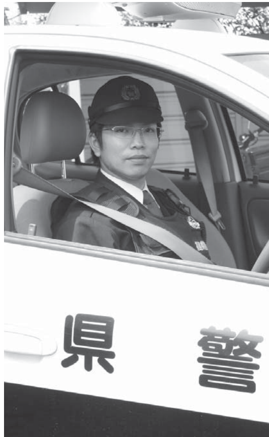
埴倉警察署埴駐在所班長