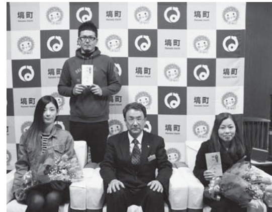
幸せな家庭を築いてください。

対象となるのは、平成28年4月1日以降に、婚姻届を提出した方から対象になります。(男女いずれかが初婚。年齢要件はありませんが、過去に結婚御祝金を受けた方は対象外です。) 町では、結婚し埴町に定住する方を全力で応援しています。