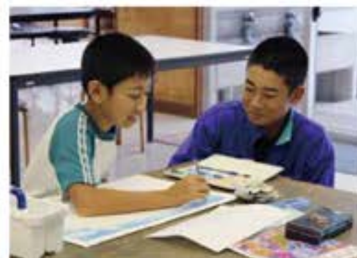
上手に書けてるね