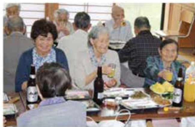
和やかな雰囲気皆さんが笑顔に (矢塚)