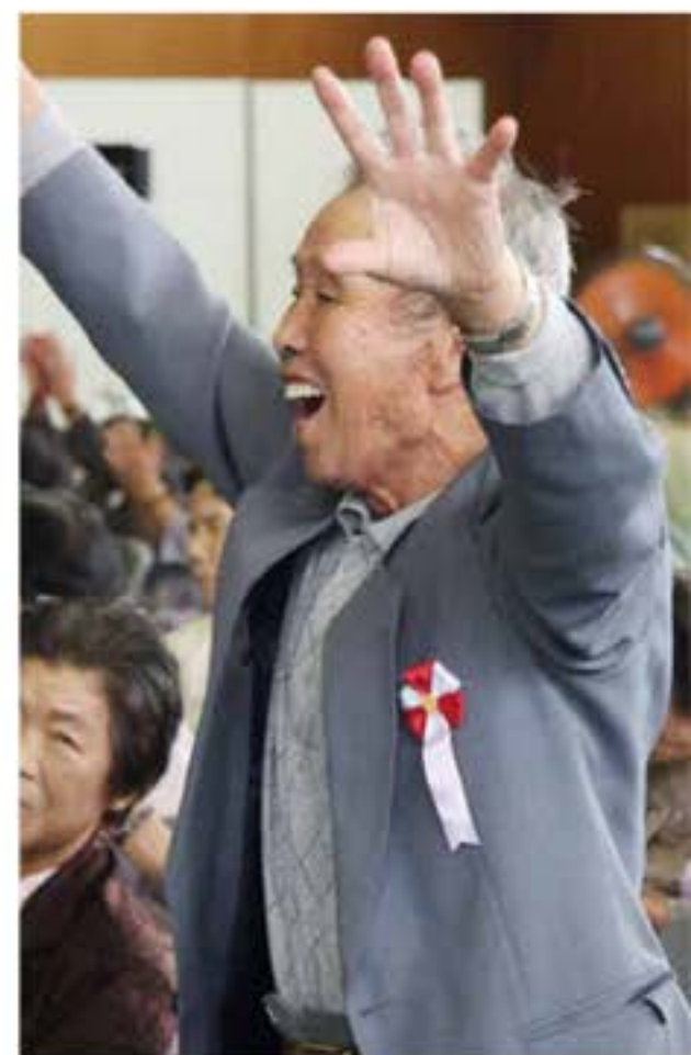
アトラクションに歓声