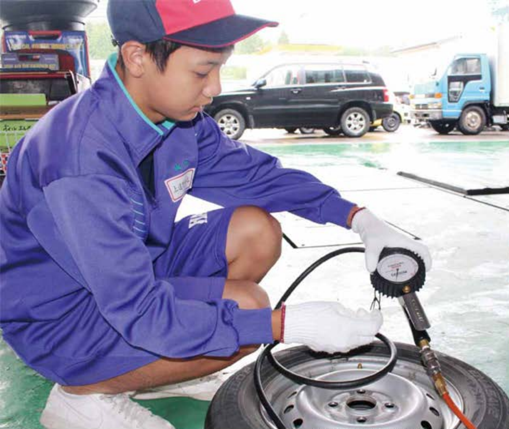
初めて見る機械に興味津々 (芳賀モーター商会 / 中学生撮影)