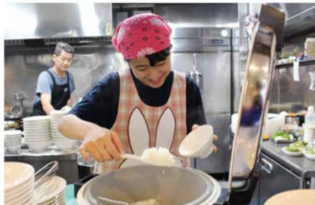
心を込めてご飯をよそります

9月9日(水)と10日(木)の2日間、塙中学校2年生の体験学習として職場体験が行われ、72名の生徒が希望する事業所などで、それぞれの仕事を体験しました。生徒たちは、慣れない仕事に戸惑いながらも、与えられた仕事に熱心に取り組み、働くことの大切さを学びました。学校内では体験することのできない貴重な体験をし、将来を考える良い機会となりました。