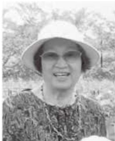
このコーナーでは、東京場会の皆さんの住む街のことや近況について紹介しています。