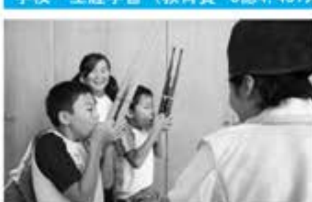
子どもたちにさまざまな学習機会を