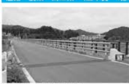
補修工事が行われた米山橋