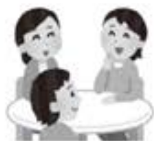
◆保健推進員伝達講習会を開催しました（台宿）

◆保健推進員伝達講習会を開催しました（台宿） 台宿の保健推進員3名による講習会が、9月2日（水）に台宿分館で行われました。研修会で学んだこと（埴町の健診や塩分について）を、台宿地区の10名の方にお伝えしました。また、「ご家庭のみそ汁の塩分測定を行い、適塩だと安心する方や、「少し味が濃いかも」と食卓を振り返っていただくとともに、地域の方と交流する良い機会となりました。