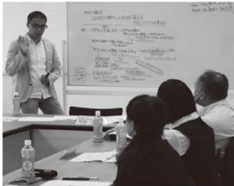
埴町に必要な戦略とは何か

地方創生……。昨今マスコミなどで耳にする言葉です。日本の人口は、2008年をピークに人口減少の局面に入り、2050年には9,700万人程度になることが予想されています。さらに、地方と東京圏の経済格差拡大などで、若い世代が地方から流出し、東京圏の一極集中を招いています。これに歯止めをかけるため、若い世代の就労・結婚・子育ての希望を実現し、地域がそれぞれの特徴を生かした事業を展開しなければなりません。 今月号は、外部有識者会議などを通して見えてきた、埴町の現状と将来について、お知らせします。