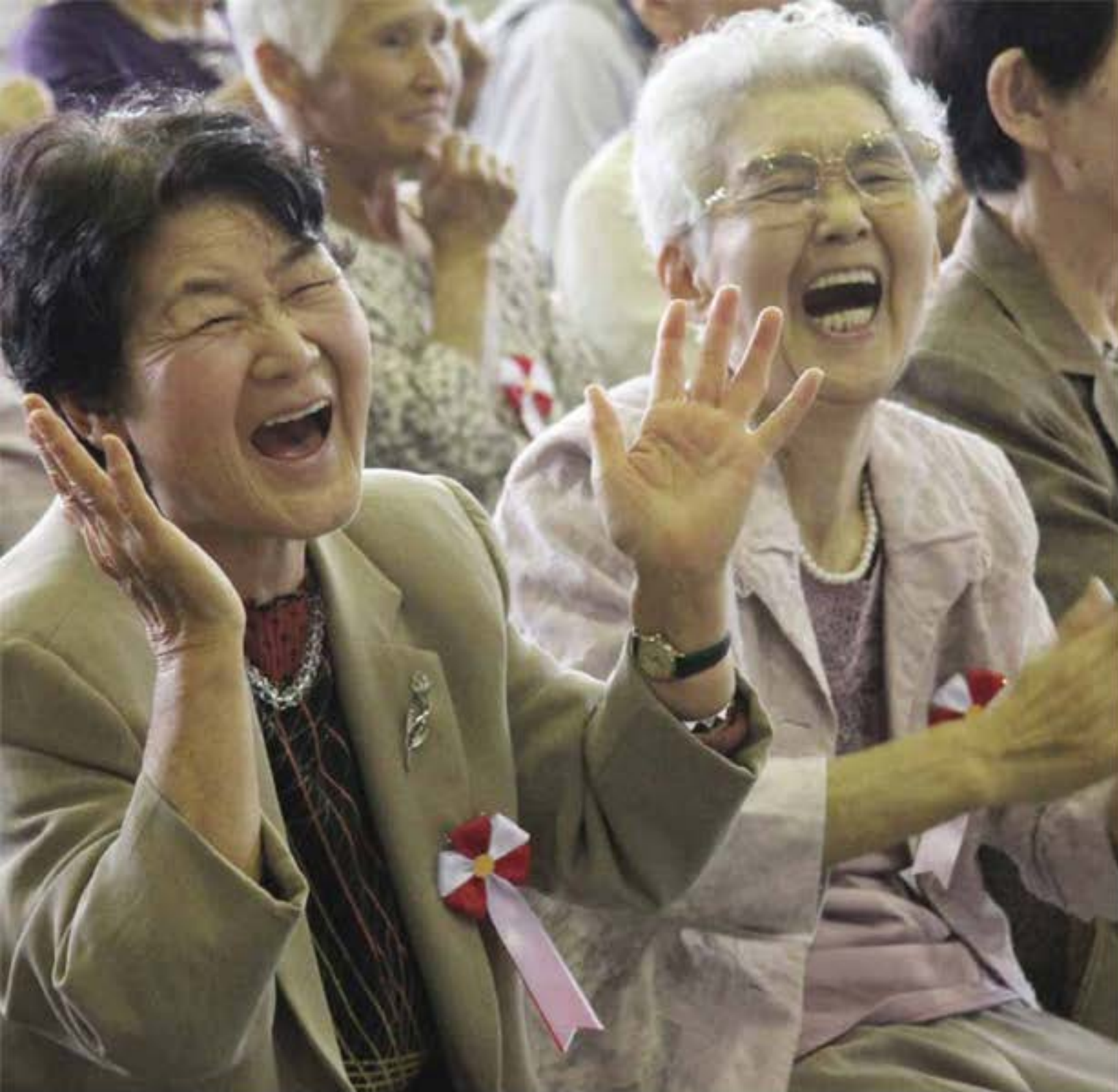
その素敵な笑顔をいつまでも