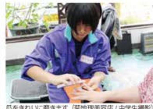
爪をきれいに磨きます (菊地理美容店)