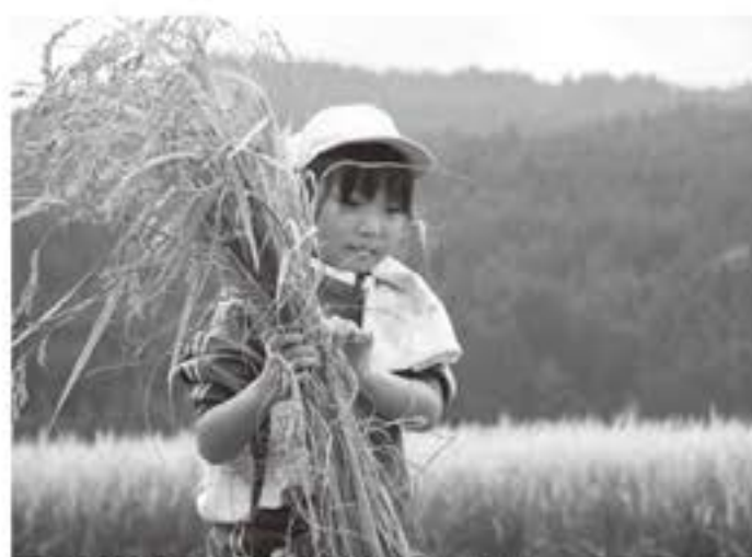
▲頭を垂れる稲穂に豊作の喜びを感じました