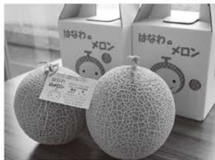
▲今年も糖度が高く、試食者からも大好評でした