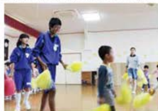
一緒に運動会の練習のお手伝い (塙幼稚園 / 中学生撮影)