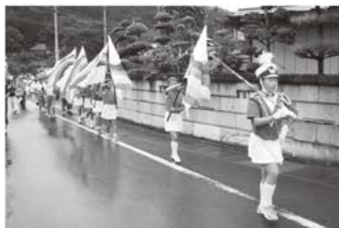
▲指揮者のもと、息の合った演奏で交通安全を呼びかけました

9月18日(金) 9月21日(月) から30日(水)にかけて展開された「秋の全国交通安全運動」に合わせ、菅原小学校児童95名による鼓笛パレードが行われました。「外出は 明るい笑顔と 反射材」をスローガンに、川上字堀ノ内から山形字森ノ根までの県道塙大津港線をパレードしました。息の合った見事な演奏で、地域住民に交通事故防止と、犯罪のない明るい社会づくりを呼びかけました。