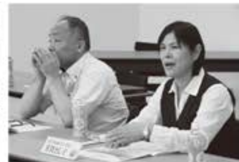
活発な議論が交わされています