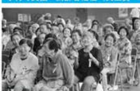
健康長寿を目指して