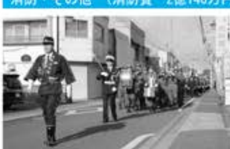
住民の生命、財産を守ります