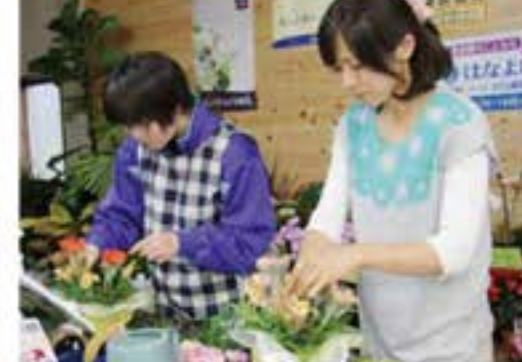
生花の取り扱いはとても緊張します (はなよし)