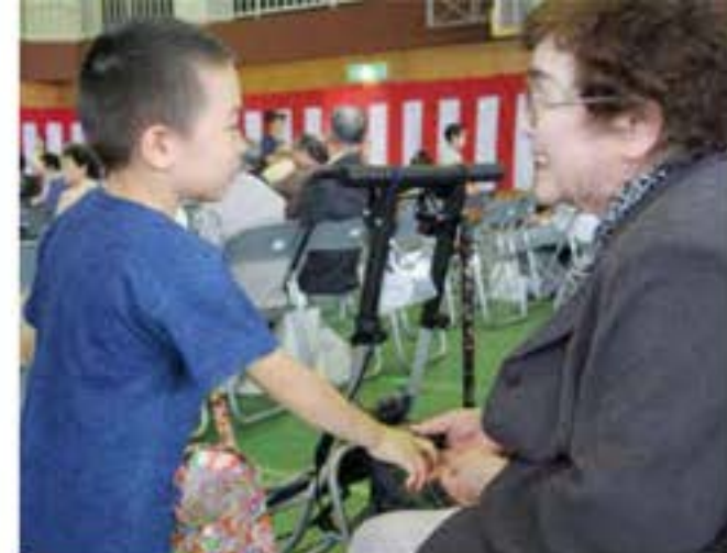
子どもたちからあめのプレゼント