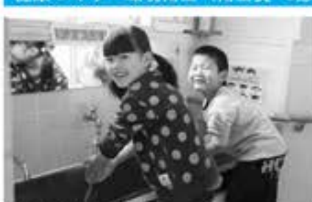
きれいな水を届けます