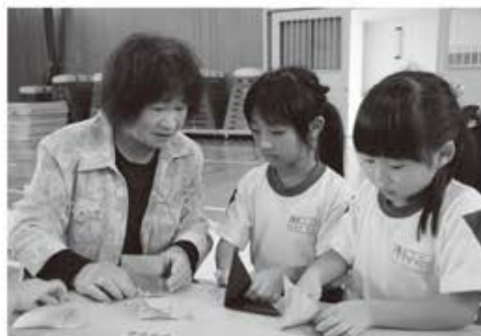
▲難しい折り方も丁寧に教えてもらいました

9月18日(金) 塙小学校1年生と祖父母との交流会が、同校体育館で行われました。昔ながらの遊びの体験と、祖父母との交流を目的に行われ、折り紙、あやとり、けん玉、コマ回しなどの昔遊びを体験しました。児童たちは、普段体験することのできない遊びに興味津々で、各コーナーでは、おじいちゃん、おばあちゃんが先生となり、児童たちに丁寧に教ながら、楽しいひとときを過ごしていました。