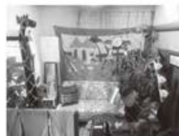
念願だったお店をオープン

した。タイや東京で出会った人々が、優しく、温かくて、嬉しかった。そんな周りの人々も含め、家族、友人、みんなのおかげで、念願だった自分のお店を、この埼玉に構えることができました。(お店をオープンするにあたり、一番親身になって相談に乗ってくれたお父さんには、感謝をしてもしまれません。本当にありがとうございます。)