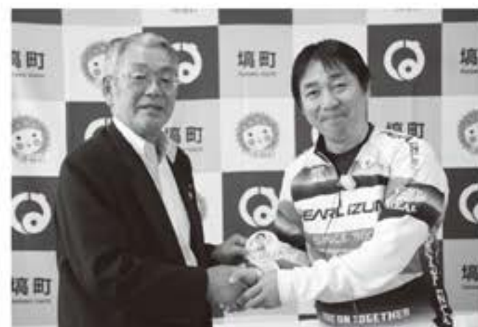
▲蘭草さん、自転車の旗頑張ってください!