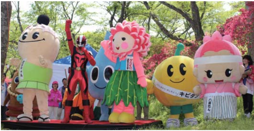
5月11日(日)のご当地キャラフェスタではオープニングセレモニーを務めました