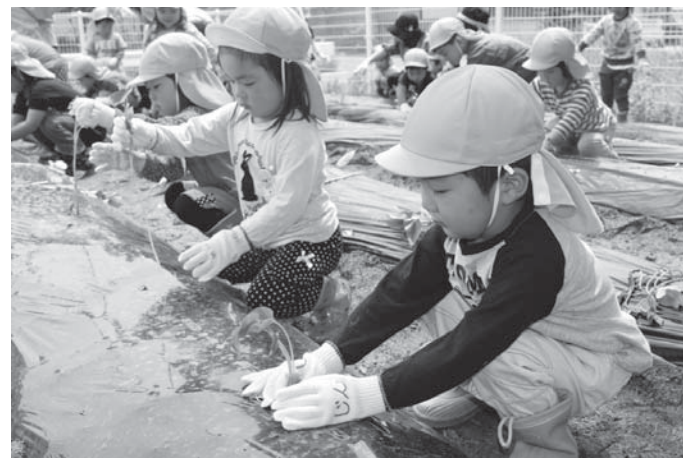
▲おいしいさつまいもができるよう丁寧に植えました