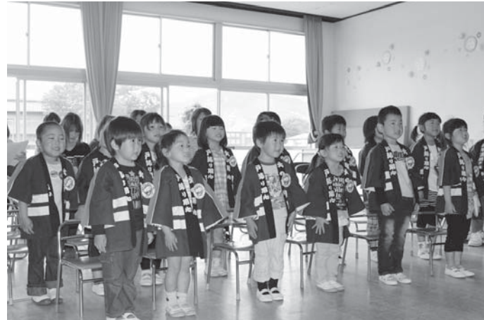
▲園児全員で絶対火遊びはしないことを誓いました