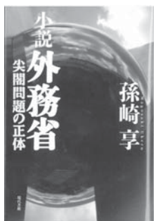
「小説 外務省」 孫崎 亨/著 (現代書館)

外交官・西京寺は外務事務次官に真っ向から反対し、外務省から追い出されるか否かの瀬戸際にいた。外務省元官僚によるノンフィクション・ノベル。