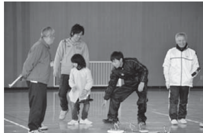
▲子どもから大人まで楽しめます

はなスポ杯第14回カローリング大会 日時 6月29日(日) 受付 午前9時・競技 午前9時30分 場所 埴町営体育館 アリーナ 資格 年齢不問(1チーム3人) 参加費 1チーム 3,000円 (会員チーム 1,500円) 申込み ①窓口②電話③FAX④メール 詳しくは、事務局までお問合せください。