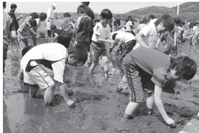
▲みんな上手に植えることができました