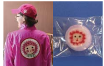
左：キャップとスタッフジャンパー 右：ダリちゃんの顔が描かれたキャンディ

商工会女性部が「ダリちゃん」関連の製品を作成し、5月2日(金)に菊池町長へ報告しました。作成したのはキャップ、スタッフジャンパーとキャンディの3種類です。キャンディについては、今後の商品化を目指し、販路などを検討中とのことです。