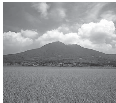
▲日本百名山の筑波山

埴町B&Gプール 6月18日オープン 今月6月18日からB&Gプール(合宿字下川原)がオープンします。全天候型施設で、どなたでも無料で使用できます。7月から8月までは、夜間も開所いたしますので、仕事帰りにも利用できます。ぜひお気軽にご利用ください。 B&G埴海洋センター 施設 25mプール 幼児用プール 開所期間 6月18日(水)～9月11日(木) 開所時間 午前9時～正午 午後1時～午後4時30分 夜間の部(7/18/31のみ) 午後5時～午後8時 定休日 月・火曜日(夏休み期間中は月曜日のみ)及び祝日の翌日 注意事項 プール利用の際には水泳帽を着用してください。 お問い合わせ ☎43-2644 生涯学習課 ☎43-3192