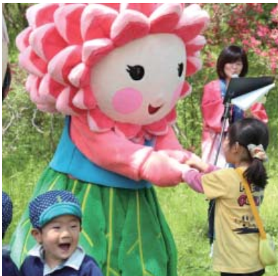
子どもたちにも大人気！

平成15年に町の花である「ダリア」のPRのために誕生したダリちゃん。これまでは、パンフレットやのぼり旗などに、たびたび登場していたが、平成24年10月に、商工会女性部の