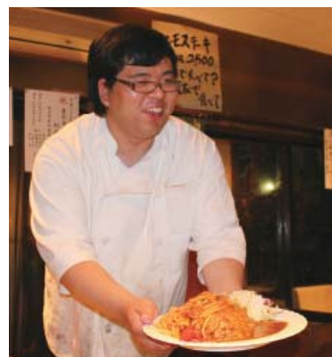
おすすめのコスモスセット (これは普通盛り)

次にお店の紹介をします。「コスモス」はレストランですが、食事の他にお酒やおつまみがあるので、小さいお子様から年齢が高い方でも楽しんでいただけます。おすすめメニューはコスモスセットです。ナポリタンとカレーとサラダがワンプレートになっていて、ボリューム満点です。大盛り、メガ盛り、ギガ盛りまであるので大食いの方に自信がある方はぜひ食べに来てください。あとは、ラーメンや定食メニューもあります。続いて、「居酒屋ほろすけ」は