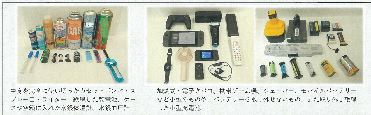
中身を完全に使い切ったカセットボンベ・スプレー缶・ライター、絶縁した乾電池、ケースや空箱に入れた水銀体温計、水銀血圧計